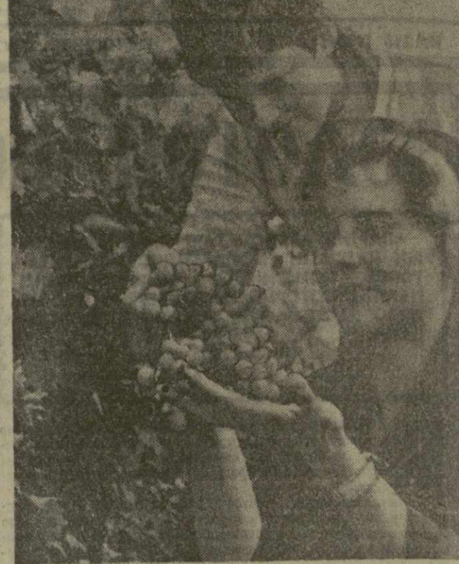
Венгрия — страна садов, виноградников, овошеводческих хозяйств. Увеличение занимаемой ими площади, рост урожайности способствуют расширению экспорта. Потребителями венгерских овощей, фруктов, консервов являются 29 стран мира. Крупнейший покупатель — Советский Союз.

Токно, 18 сентября. (ТАСС). В порт Наха на Окинаве зашла вчерашняя американская атомная подводная лодка. Обширный взрыв произошел в омакском порту, несмотря на протесты населения против захода американских атомных подводных лодок в этот порт. Это движение протеста развернулось с силой лишь в последние дни. В связи с обнаружением радионуклидов в водах и грунте порта Наха после взрыва атомной подводной лодки выступили демократические организации, которые объединяются вокруг Окинавского совета за запрещенное атомное и водородное оружие.