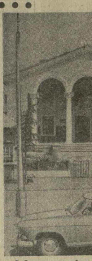
На снимке: Дом культуры Очамурского чайного совхоза.