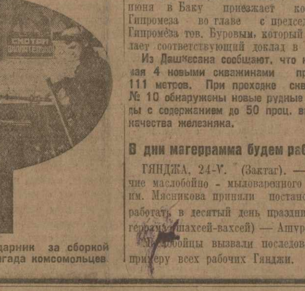
Паровоз-ремонтный завод им. Сталина (Тифлис), ударник за сборку цилиндра паровоза; в овале — ученическая ударная бригада комсомольцев.