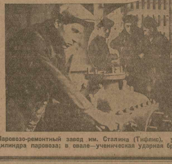
Паровоз-ремонтный завод им. Сталина (Тифлис), ударник за сборку цилиндра паровоза; в овале — ученическая ударная бригада комсомольцев.

В. И. ЛЕНИН. 25-го мая начался рассылка очередных 17 и 18-й приложений: VII и XI тома. Издательство «Заря Востока».