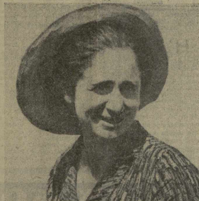
Чаеводы колхоза имени В. И. Ленина села Окурия Гальского района месяц назад выполнили годовое задание по сбору чайного листа. На чайную фабрику они отравили 1.200 тонн сырья — на 200 тонн больше плана. Сбор чая в колхозе продолжается. До конца сезона окупки обещают собрать еще не менее двухсот тонн сырья и довести урожайность плантации до 600 килограммов чая с гектара.