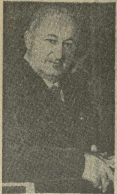
В. И. Мурадели.

Сегодня мне от всей души хочется поздравить видного советского композитора Вано Мурадели с присвоением ему высокого звания народного артиста СССР.