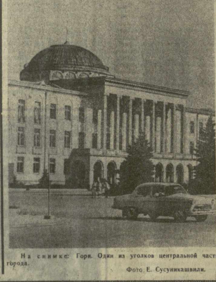
На снимке: Горы. Один из уголков центральной части города.