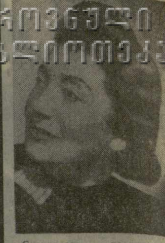
Скончался талантливый представительница грузинского вокального искусства, известная певица, гордость грузинской эстрады Кетеван Константиновна Джпаридзе.