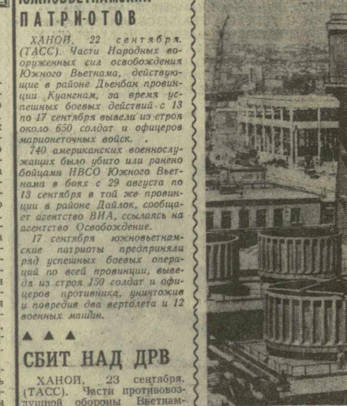
Венгерская Народная Республика. Петский азотный комбинат близ озера Балатон (на снимке) наращивает мощности. Здесь сооружается завод, который ежегодно будет выпускать 100.000 тонн удобрений.

Председателем президиума Торговой палаты республики вновь избран Р. Елигулашвили. (ГрузТАГ).