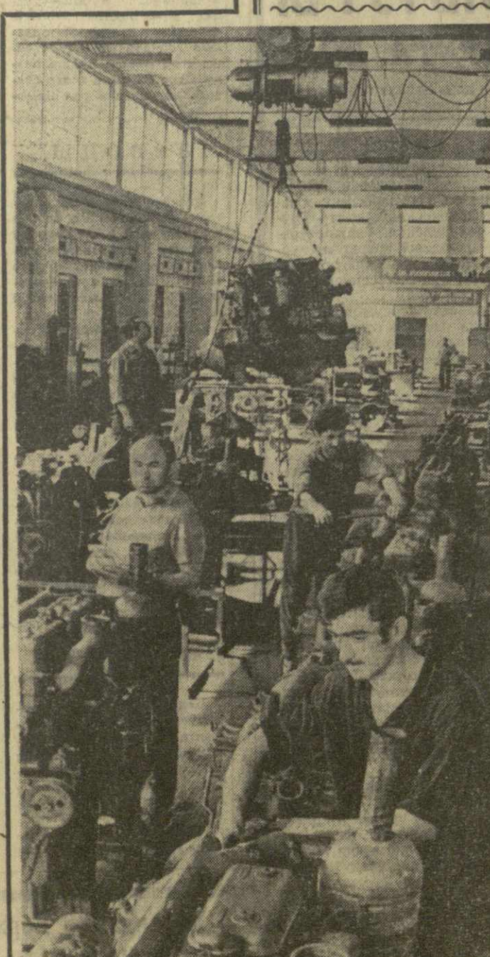
Отличных трудовых показателей добивается коллектив Дигомского ремонтного завода «Груссельтехника». Включившись в социалистическое соревнование в честь 100-летия со дня рождения В. И. Ленина, труженники предприятия досрочно выполнили девятимесячный план.

В самом совхозе организованы три комсомольско-молодежные бригады. Это бригады механизаторов, виноградарей и садоводов. Все они успешно завершают нынешний сельскохозяйственный год. Бригада ме-