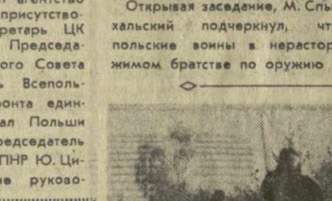
25 лет назад первые подразделения польских вооруженных сил, созданные на советской земле, приняли боевое крещение под белорусским знаменем Ленино, разгромив войска фашистских захватчиков.

На заседании выступили с речами В. Гомулка, А. А. Гречко и министр национальной обороны ПНР генерал брони В. Ярузельский.