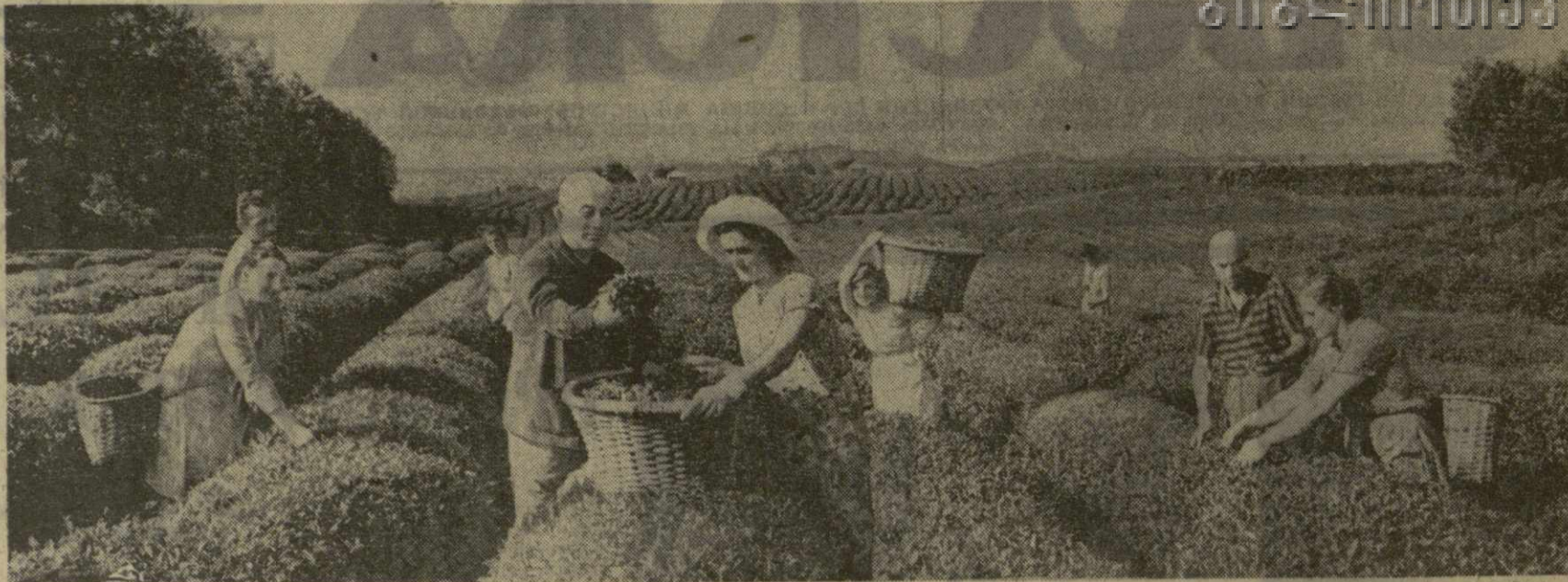
Нелегким оказался нынешний сезон для труженников колхоза села Хабуме Чхорокского района. Но, несмотря на засуху, труженники чайных плантаций успешно выполнили годовой план, а затем и обязательства.

Работники сельского хозяйства полны решимости добиться новых, еще более крупных успехов в соревновании за досрочное выполнение пятилетки, достойную встречу 100-летия со дня рождения В. И. Ленина.