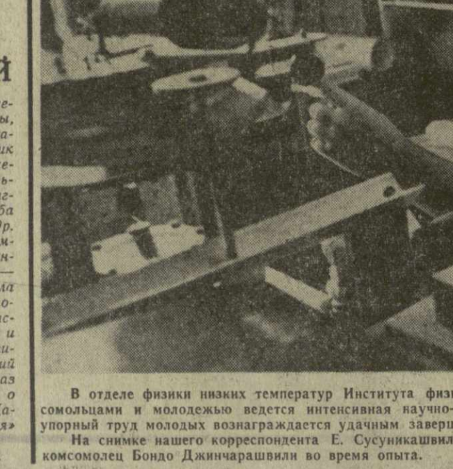
В отделе физики низких температур Института физики Академии наук Грузинской ССР комсомольцами и молодежью ведется интенсивная научно-исследовательская работа.

Архитекторы, специалисты коммунального хозяйства, работники книжной торговли. «Стройиздат» выпускает 20 журналов, в которых освещаются передовой опыт работы строительных организаций, предприятий промышленности строительных материалов и жилищно-коммунального хозяйства, проектных и научно-исследовательских институтов.