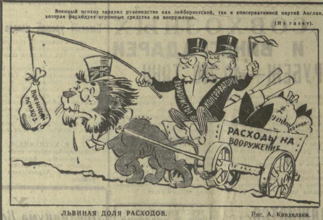
Львиная доля расходов. Рис. А. Канделани.

ции, проходившей под лозунгом немедленного предоставления независимости Канарским островам. Полиция разогнала демонстрантов, применила оружие. Заключенные являются активными сторонниками за самоуправление и независимость Канарских островов.