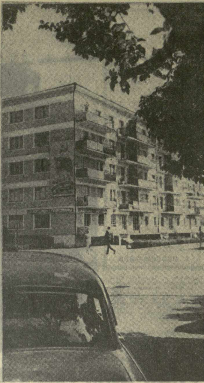
На этом снимке наш фотокорреспондент запечатлел улицу Шота Руставели в Зугдиди. Много красивых и живописных улиц в этом городе.

Обелиск памяти карельцев — бойцов и офицеров Советской Армии, погибших в боях с фашистскими захватчиками в 1941—1945 годах, воздвигнут в районном центре Карелии.