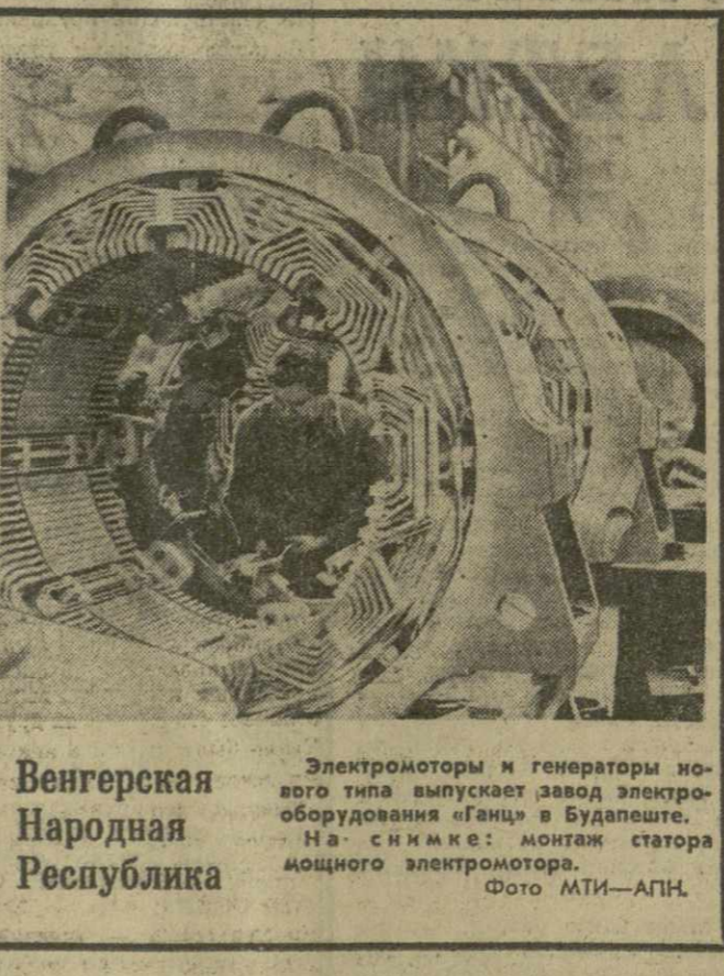
Венгерская Народная Республика. Электромоторы и генераторы нового типа выпускает завод электрооборудования «Ганц» в Будапеште. На снимке: монтаж статора мощного электромотора.

Объединенный комитет ЛПНС заявляет, что «американская агрессия в Лаосе является источником напряженности в этой стране. Американская агрессия, усиленная бомбардировками, осуществившихся — а с о летями «В-52» — Лаосе, создала опасность расширения войны, серьезно угрожает миру и безопасности в Индокитае и Юго-Восточной Азии».