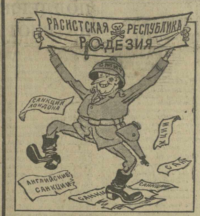
ТАНЕЦ С САНКЦИЯМИ. Рис. Г. Ломидзе.

НЬЮ-ЙОРК, 13 марта. (ТАСС). Вчера здесь состоялась очередная встреча представителей СССР, США, Франции и Англии при ООН по вопросу о политическом урегулировании положения на Ближнем Востоке. Следующую встречу намечено провести 19 марта.