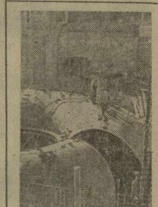
Передачу из цикла «На строительстве «Ингури-ГЭС» смотрите 21 марта.

16 МАРТА. 10.00 — Студентам-заочникам. Лекция по общей физике. 11.00 — Кинопрограмма. 11.45 — Из Москвы. Цветное телевидение. Для детей. 12.15 — Из Москвы. Музыкальная программа. 12.45 — Из Москвы. Музыкальная программа. 13.05 — «Телепарки». 13.45 — «Моя земля». 14.00 — «Моя земля». 14.15 — «Моя земля». 14.30 — «Моя земля». 14.45 — «Моя земля». 15.00 — «Моя земля». 15.15 — «Моя земля». 15.30 — «Моя земля». 15.45 — «Моя земля». 16.00 — «Моя земля». 16.15 — «Моя земля». 16.30 — «Моя земля». 16.45 — «Моя земля». 17.00 — «Моя земля». 17.15 — «Моя земля». 17.30 — «Моя земля». 17.45 — «Моя земля». 18.00 — «Моя земля». 18.15 — «Моя земля». 18.30 — «Моя земля». 18.45 — «Моя земля». 19.00 — «Моя земля». 19.15 — «Моя земля». 19.30 — «Моя земля». 19.45 — «Моя земля». 20.00 — «Моя земля». 20.15 — «Моя земля». 20.30 — «Моя земля». 20.45 — «Моя земля». 21.00 — «Моя земля». 21.15 — «Моя земля». 21.30 — «Моя земля». 21.45 — «Моя земля». 22.00 — «Моя земля». 22.15 — «Моя земля». 22.30 — «Моя земля». 22.45 — «Моя земля». 23.00 — «Моя земля». 23.15 — «Моя земля». 23.30 — «Моя земля». 23.45 — «Моя земля». 24.00 — «Моя земля».