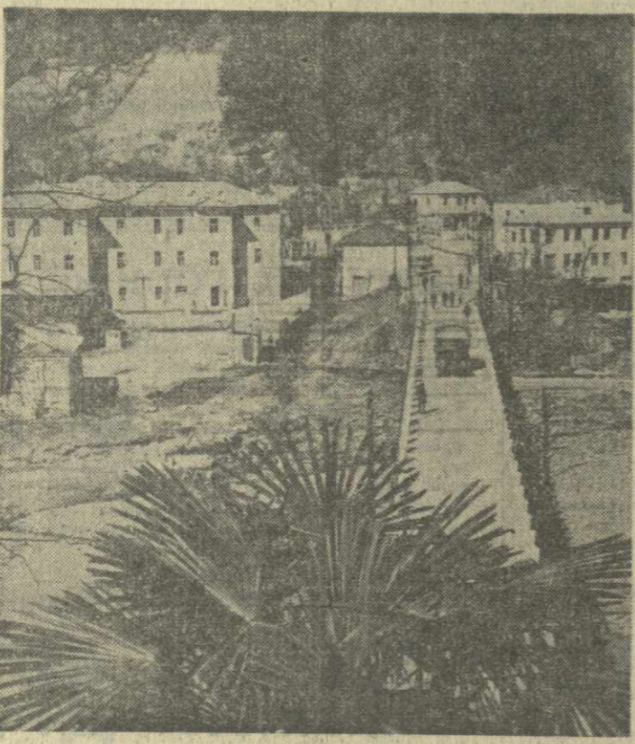
На снимке: вид на районный центр Кеда.