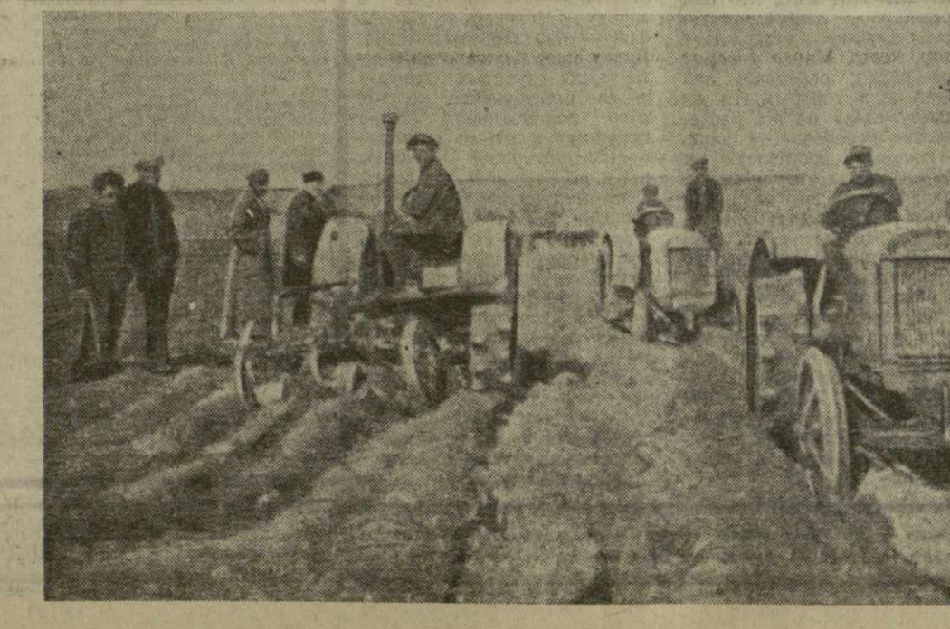
На снимке: первые тракторы в Грузии на полях сельскохозяйственного кооператива села Метехи Каспского района.

В селении Анцха Сухумского района на средства крестьян приступили к строительству народного дома.