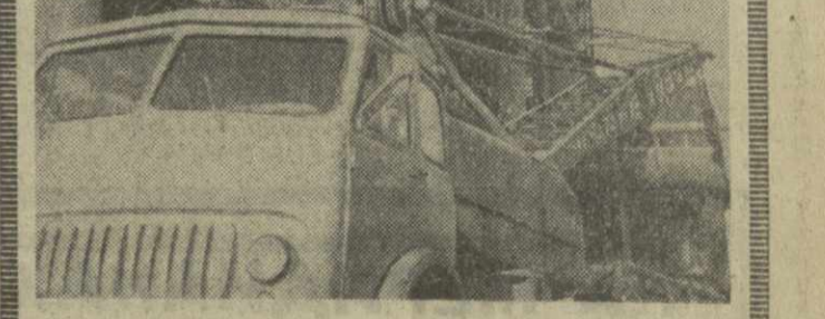
Вологодская область. Напряженный трудовой ритм поддерживается на строительстве 4-й доменной печи Череповецкого металлургического завода. Гигантская домна объемом 2.700 кубических метров должна выдать первый чуган уже к концу текущего года. Она будет давать в год 1 миллион 800 тысяч тонн чугуна, то есть столько, сколько его выплавляют за год Дания, Норвегия и Турция вместе взятые.

Площадь производственных помещений Елгавского завода составит 50 тысяч квадратных метров. Здесь разместятся цех — штамповочный, гальванический, малярный, цех внутренней отделки салонов автобусов. Выпуск и сборка машин будут осуществляться на двух поточных линиях. Годовая мощность предприятия — более 12 тысяч микроавтобусов. Это — в пять раз больше, чем выпускается сейчас.