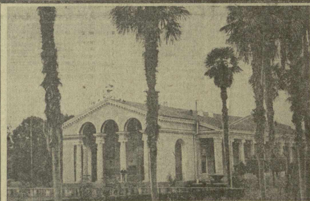
После напряженного трудового дня приятно посмотреть интересный кинофильм, послушать выступление кружков художественной самодеятельности, сыграть с друзьями в шахматы и т. д. Вот и приходило вечерам рабочие и служащие ГАРГского цитрусового совхоза в свой Дом культуры.