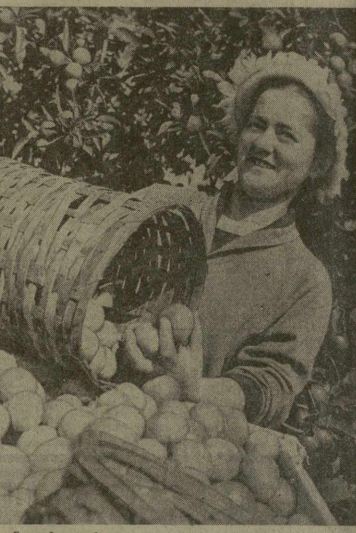
Богатый урожай цитрусовых вырастили в этом году труженники колхозов и совхозов Абхазской АССР. В Москву, Ленинград, Киев и другие города страны уже отправлены первые десятки тонн мандаринов.

Наступила ответственная пора. В эти дни райкомы партии, местные Советы, первичные партийные и комсомольские организации субтропических хозяйств, паквочных и автотранспортных предприятий должны усилить организаторскую работу, обеспечить все необходимые условия для успешного выполнения и перевыполнения государственных планов, сделать еще один крупный шаг вперед на пути претворения в жизнь решений XXIII съезда КПСС.