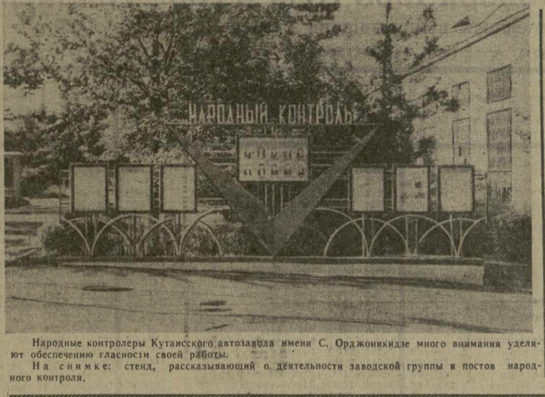
Народные контролеры Кутаисского автозавода имени С. Орджоникидзе много внимания уделяют обеспечению гласности своей работы. На снимке: стенд, рассказывающий о деятельности заводской группы и постов народного контроля.