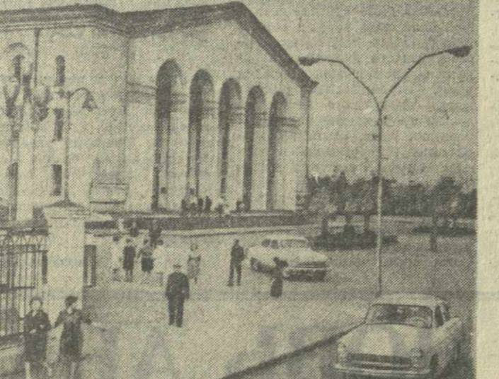
На снимке: Дворец культуры города Ткварчели.