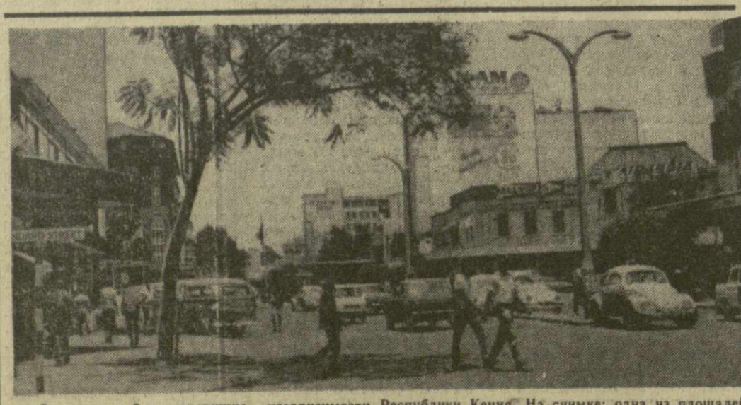
Завтра — 5-я годовщина независимости Республики Кения. На снимке: одна из площадей столицы Кения — Найробы.

НЬЮ-ЙОРК, 10 декабря. Корр. ТАСС С. Лосея передает: Верховный суд США отклонил вчера иск защиты новоорлеанского бизнесмена Клея Шуу, добивавшегося изъятия дела Шуу из ведения окружного суда Нового Орлеана и окружного прокурора Джима Гаррисона. Вчерашнее решение Верховного суда отклонить иск защиты дает возможность наметить дату суда над Шуу.