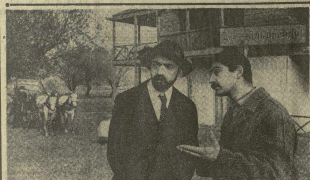
Вблизи озера Лиси идет съемка цветного художественного фильма «Пиромантия»...