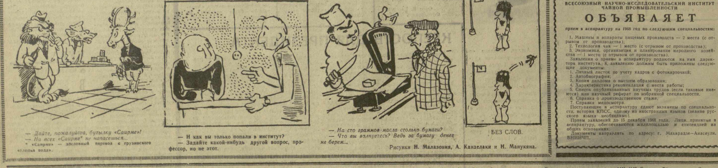
— Дайте, пожалуйста, бутылку «Сайреме!»... — И как вы только попали в институт?... — На сто граммов масла столько бумаги?...