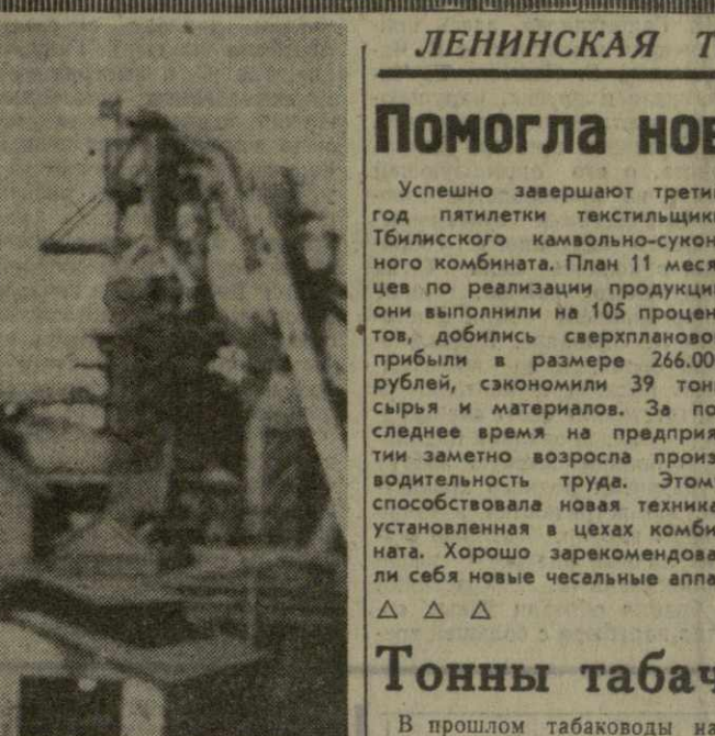
Колхоз имени Ленина села Чаусуби Кобулетского района одно из передовых хозяйств республики. Сейчас в цитрусовых садах колхоза страдная пора. Колхозники широко развернули социалистическое соревнование в честь столетия со дня рождения В. И. Ленина.