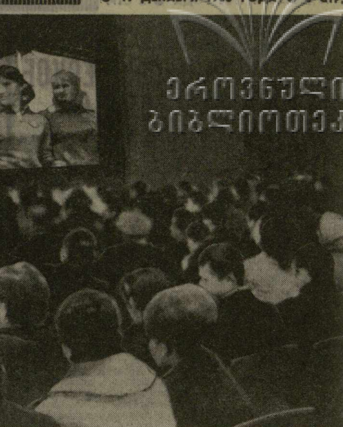
На снимке: демонстрация представленного на конкурсе художественного фильма «В небе только девушки» в кинотеатре имени Руставели.

Вопросы массовой физической культуры постоянно находятся в сфере внимания нашей партии и правительства. Делается все для того, чтобы советское физкультурное движение носило подлинно общенародный характер.