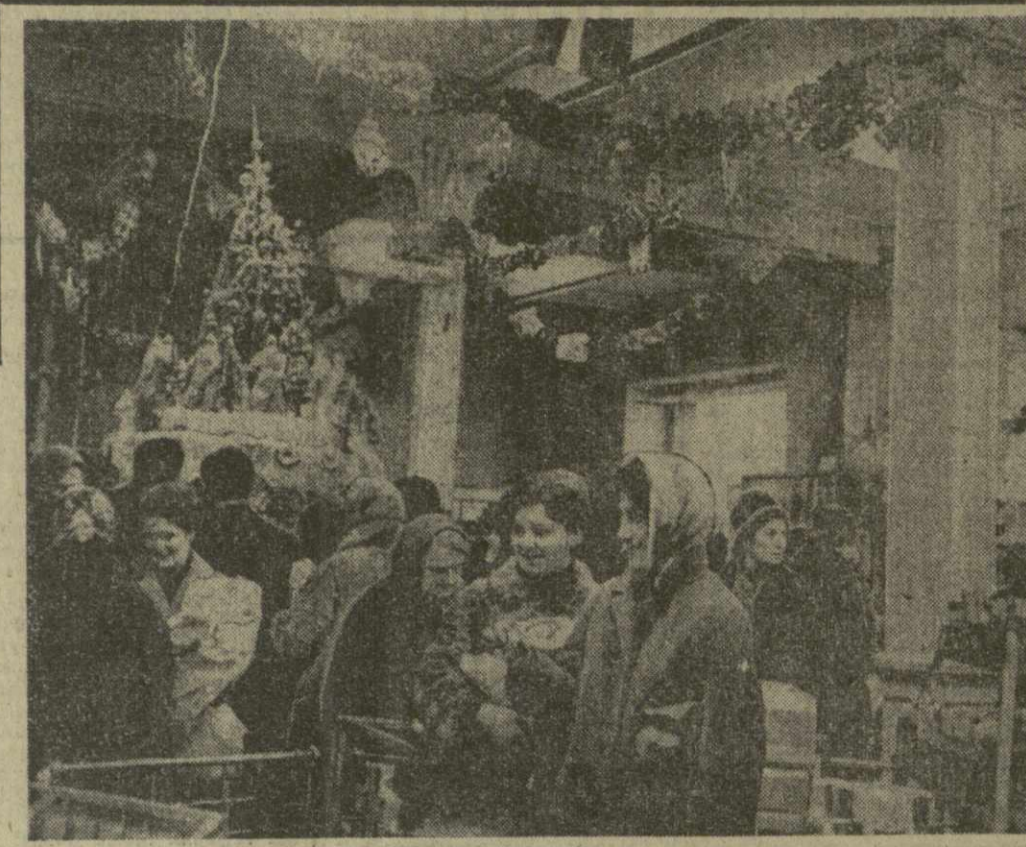
На снимке: предпраздничная торговля в центральном универмаге.

В январе нового года состоится открытие пленума Союза архитекторов, подготовка к которому уже ведется.