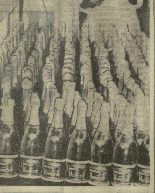
На снимке: новая партия вил перед отправкой многочисленным адресатам.

Вот почему такой доброй славой пользуется продукция Тбилисского завода шампанских вин. Ее знают далеко за пределами нашей республики.