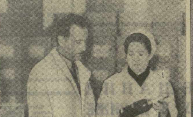
Вот почему такой доброй славой пользуется продукция Тбилисского завода шампанских вин.

СОЛНЕЧНЫМ напитком часто называют шампанское вино. И действительно, игристое и шипучее, оно как бы вобрало в себя лучи солнца.