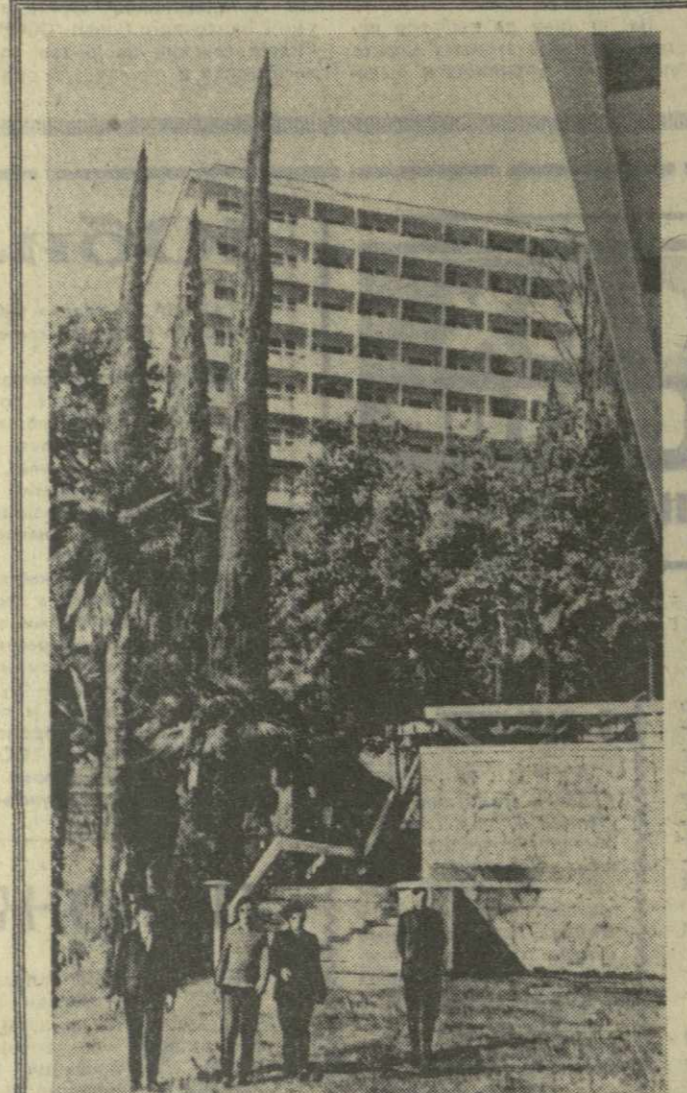
На снимке: вид на санаторий «Колхида».