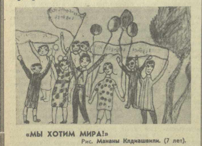
«МЫ ХОТИМ МИРА!» Рис. Мананы Киднашвили. (7 лет).