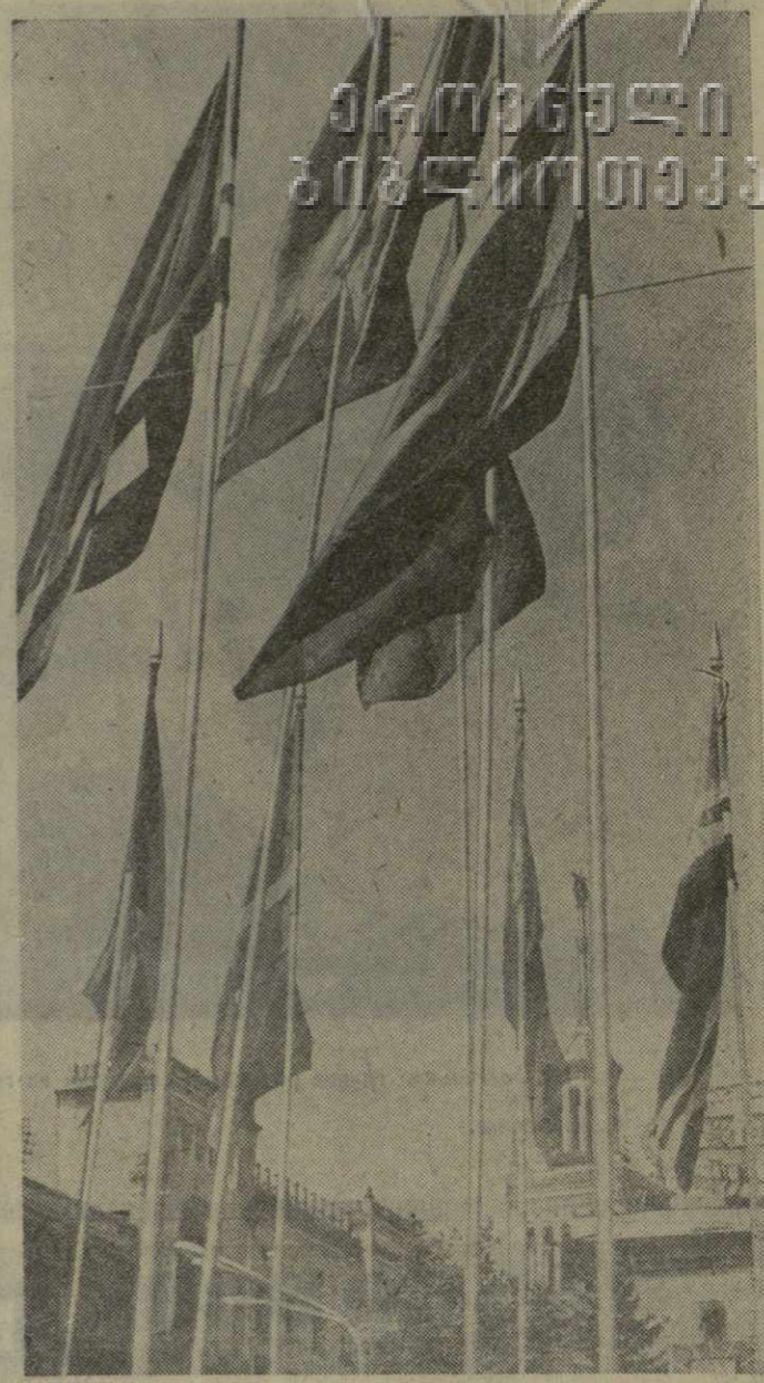
Город — в праздничном уборе. Лазурь неба, золото солнечных лучей, изумруд весенней зелени и яркость первомайских знамен создают неповторимую гамму красок.