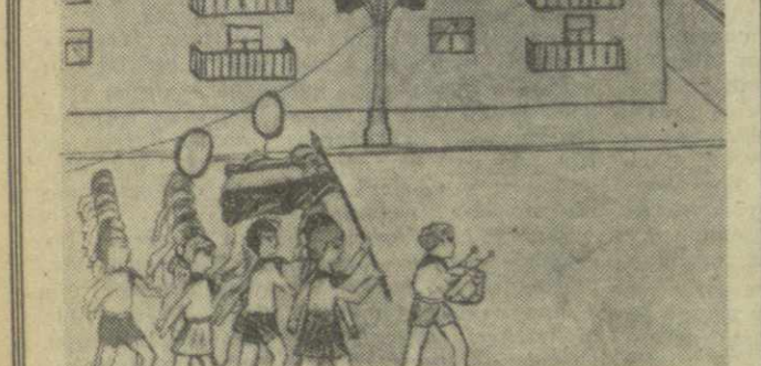
«ПИОНЕРСКИЙ ПАРАД» Рис. Нури Берниадзе. (9 лет).

АДРЕС РЕДАКЦИИ: Тбилиси, пр. Руставели, 42