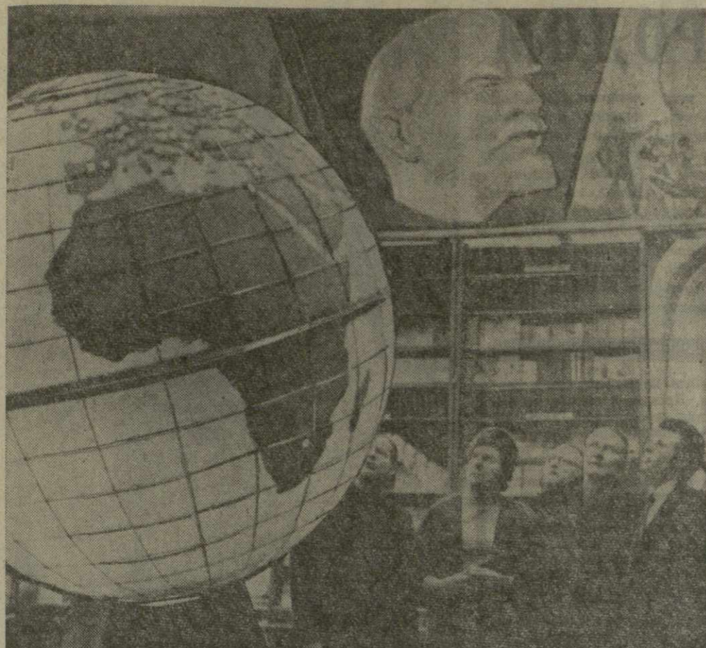
На снимке: группа рабочих и служащих из города Эрфурта (ГДР) в Музее В. И. Ленина.

ОГРОМНЫЙ глобус выставлен на подставке в просторном и светлом зале Центрального музея В. И. Ленина. Медленно и величаво вертится он вокруг своей оси. На глобусе — красивые даты. Они вспыхивают, словно маленькие костры, пламенеют яркими красками. Эти значки обозначают места на нашей планете, в которые пришло ленинское слово. Весь земной шар усеян ими!