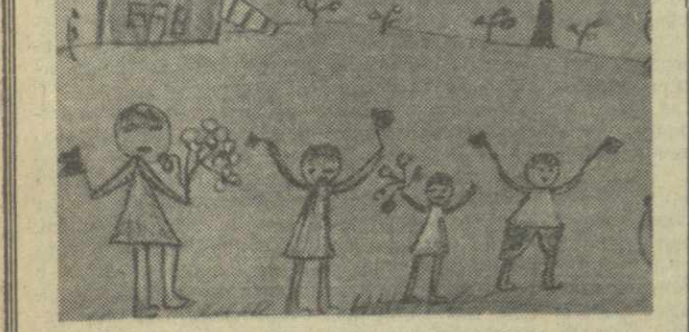
«ПУСТЬ ВСЕГДА БУДЕТ СОЛНЦЕ» Рис. Лили Надарейшвили. (5 лет).