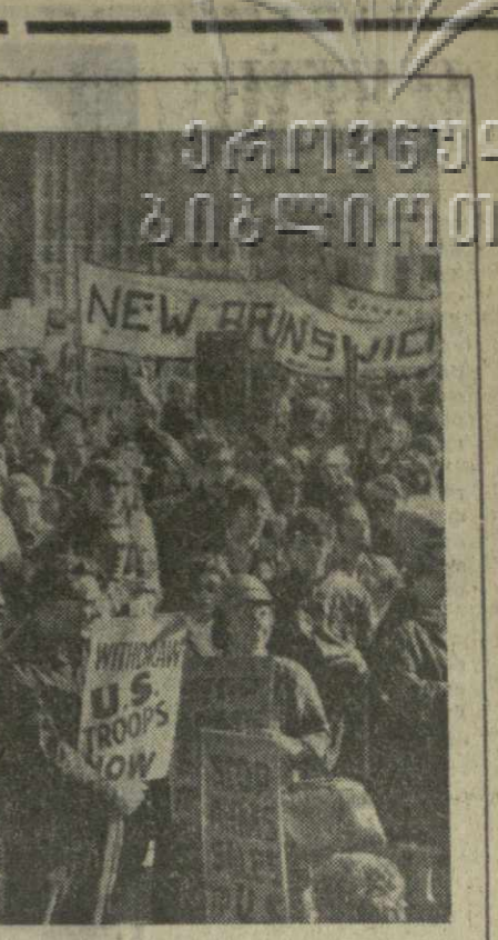
Участники демонстрации несли лозунги: «Янки, вон из Камбоджи!»...