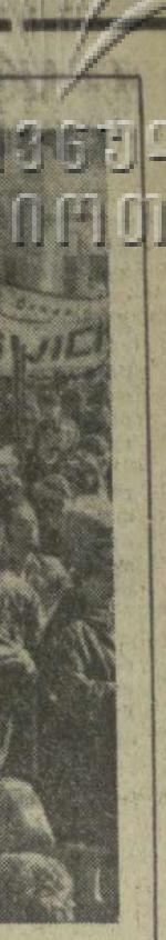
Участники демонстрации несли лозунги: «Янки, вон из Камбоджи!»...