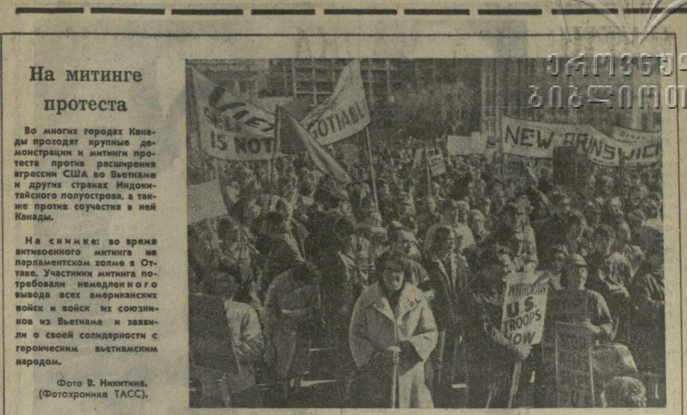
Во время антивоенного митинга на парламентском холме в Оттаве...