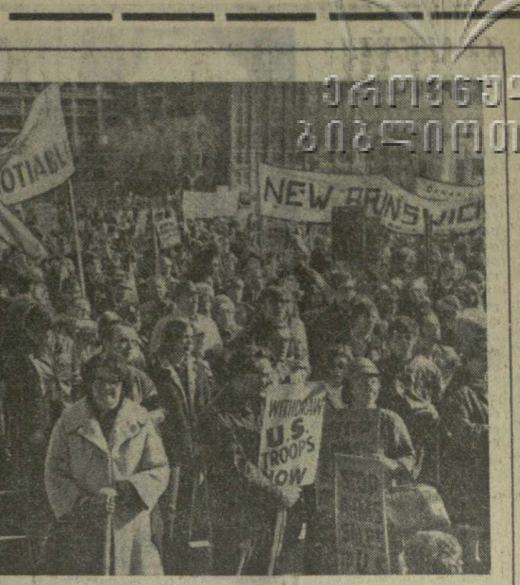
Участники демонстрации несли лозунги: «Янки, вон из Камбоджи!»...