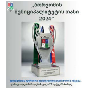
ფესტივალის ტურნირი დაწესებულებებს შორის იწყება. გამარჯვების მოდის ვადა 27 სექტემბრამდე.