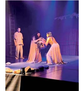
სიცოცხლე შთაბრძენს ნენებში გამომწყვდეულ სიუჟეტებს, სიმბოლოებს. ვფიქრობ, რომ მართლაც დიდი გამბედაობა იყო რეჟისორის მხრიდან, რამდენიმე საუკუნის წინ შექმნილი შედევრი სულ სხვაგვარად გამოიყურებოდა კიდევ მეტად ახლოს დანახვა მაყურებლის პიესის ავტორის ჩანაფიქრი და მთავარი სათქმელი.

რომ ხელმწიფეს გამოადგა, სამშობლო დაიცვა. თუცა, პირველი პატარა გამარჯვებისთანავე ჩნდება ნარცისიზმი, საუთნავი შესაძლებლობების ვადამეტებულად შეფასების საფრთხე. სამეფო კარისკენ მიმავალ განხვ სარდალს კუდიანები ხედიან და არწმუნებენ, რომ პატარა გამარჯვება უმაღლეს საფეხურამდე დაწინაურების წინაპირობა შეიძლება გახდეს. კუდიანები მაკბეტს უწმინდი ილუზიას იძიას, რომ იგი შეიძლება დუქანზე უკეთეს მონარხად ჩამოყალიბდეს; რომ იგი გვირგვინს უპირობოდ იმსახურებს; მის მიერ მიზნის მისაღწევად ნებისმიერი საშუალების გამოყენება გამართლებულია. ალქაჯების შეგონებას კეპრს დაუკრავს ლდი მაკბეტიც და ნანარჩოების მსველდობისას რანდი ამბიციურ, ყველაფრის ცდარეულად, ხახვრად მუშობი მკვლელად გადაიქცევა, რომელიც სიცოცხლეს უნადრუკად დასაჯრულებს. სწორედ ამ კლასიკური ვარიანტისაგან სრულიად გამორჩეული და განსხვავებული ხელნერი გამოიჩინა „მაკბეტი ილუზია“, რომელიც რეჟისორმა დინა ურმაზაშვილმა საუთნად, მისეული ესკიზებით გააცოცხლა სენაზაზე. რეჟისორმა საუთნად ნამუშევრით დროში გაგაშაზურა თანამედროვე ელემენტებით ერთად გენიალური სასაბიბოო შესრულება, ნამდვილი პროფესიონალიზმი, მუსიკალური გაფორმება, გემოვნებით შერჩეული კოსტიუმები კიდევ მეტად მისტიკურსა და გამორჩეულს ხდის ნარმდებებს. თითოეულ მსახიობს მერაოდ უწოდებენ, „სცენის ჯალდებებს“. ისე მოგვსებს და მოგვაჯადოებს იქ მყოფი საზოგადოება, რომ დიდხანს არ გენდოდა სპექტაკლის დასრულების შემდეგაც წამოსვლა.