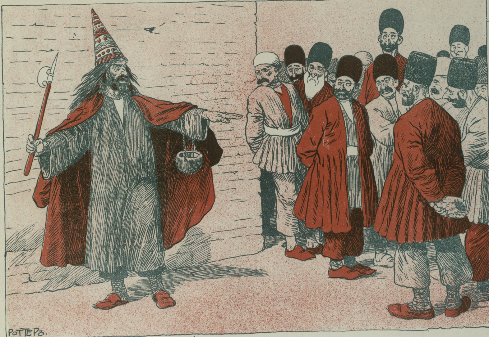
«Մակեդոնիա» սնկի (պոլիտգայի Դայր Նոյոն)