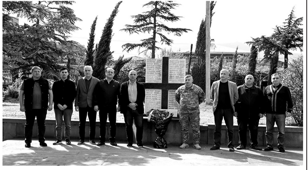
- შიდა ქართლი -

მთავრობის განკარგულებით, ამ დღეს, საქართველოს მთელს ტერიტორიაზე, მათ შორის ხაშურში, სახელმწიფო და მუნიციპალური დროშები დაშვებული იყო.