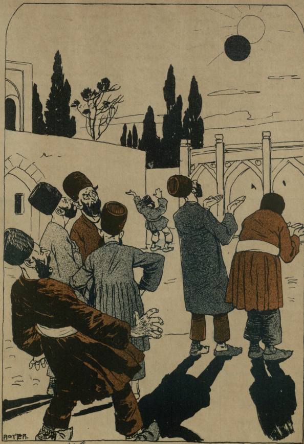
დოქტორ გლონ ბრე. აჲ ალჲ ! (გონიგ თოთლაგი)