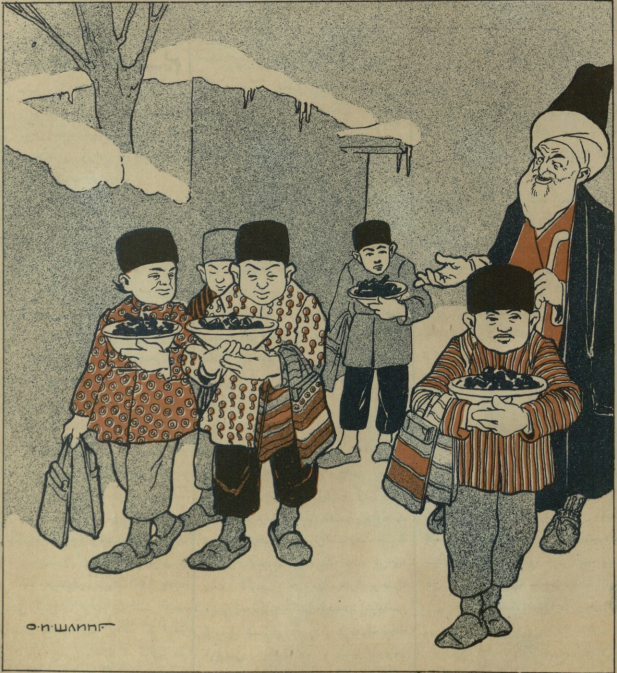
برکس بولون مانقال گتوردرسه مکتبه 'ملا اونک آيا ملا رينی تو ریا جات فلاقعا یا ....