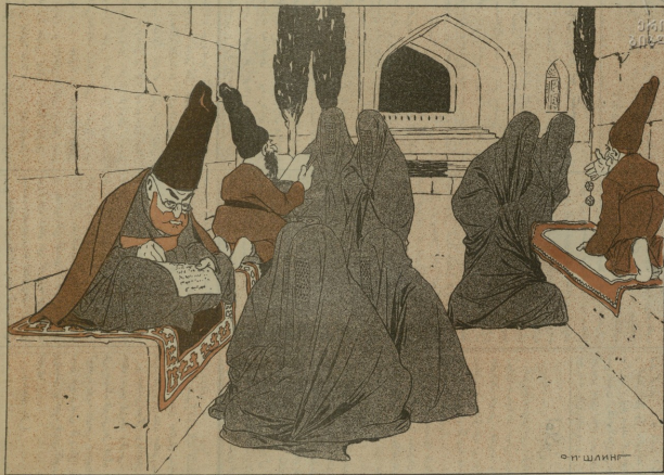
Խրքերը «Վախճանի» խորհրդակցությանը