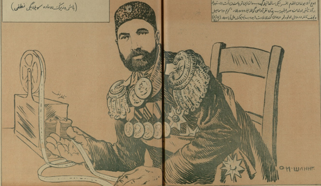
« من جمیع مسلمانانک طرفندن جانشین حضرت زینب عیض ایبریم که بزم مسلمانان جا مری گلزی حکومتک یولینده ندا ایتمک حاضرین » گزال تقی پوف .

د روسیه ده آفاق ایدن دین کرک خاج پرست دینی اولا » (باش وزیرک دوماده سولیدگی نطق)