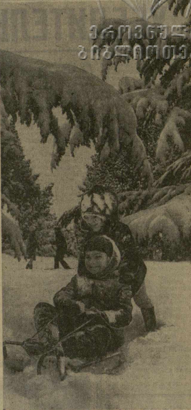
Снег на горе Мтацминда.

Ничейный результат был зафиксирован также во встречах