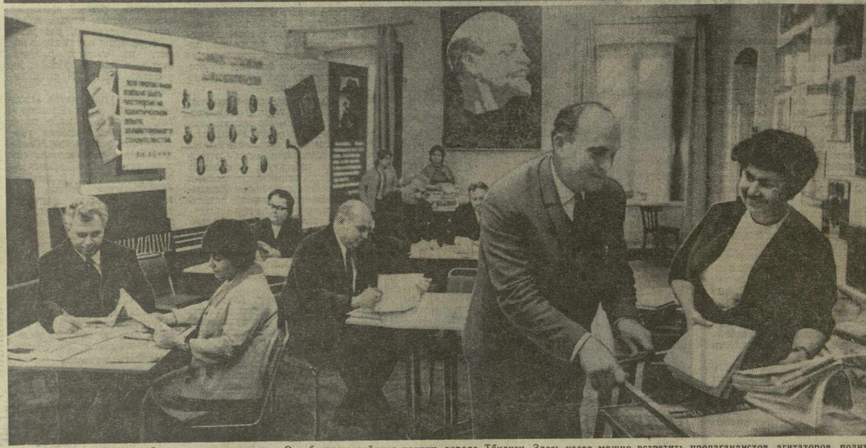
Всегда многолюдно в кабинете политпросвещения Октябрьского райкома партии города Тбилиси. Здесь часто можно встретить пропагандистов, агитаторов, политинформаторов, которые приходят в кабинет получить консультацию, обменяться мнениями, подобрать нужную литературу.