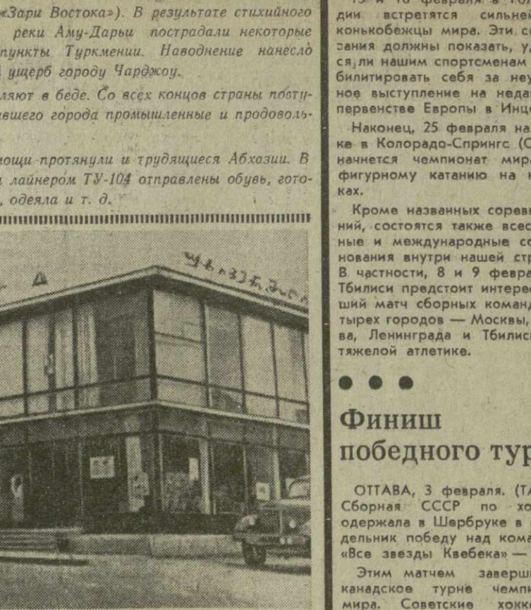
В городах и селах республики с каждым годом растет число объектов службы быта и торговли. Большой популярностью среди населения города Хашури пользуется новый универсам. На снимке: здание Хашурского университета.

СУХУМИ. (Корр. «Зари Востока»). В результате стихийного бедствия при разливе реки Аму-Дары пострадала некоторые города и населенные пункты Туркмении. Наводнение нанесло большой материальный ущерб городу Чардыню. Но друзей не оставляют в беде. Со всех концов страны плывут в адрес пострадавшего города промышленные и продовольственные товары. Руку братской помощи протянули и трудящиеся Абхазии. В Туркмению воздушным лайнером Ту-104 отправлены обувь, готовая одежда, трикотаж, одежда и т. д.