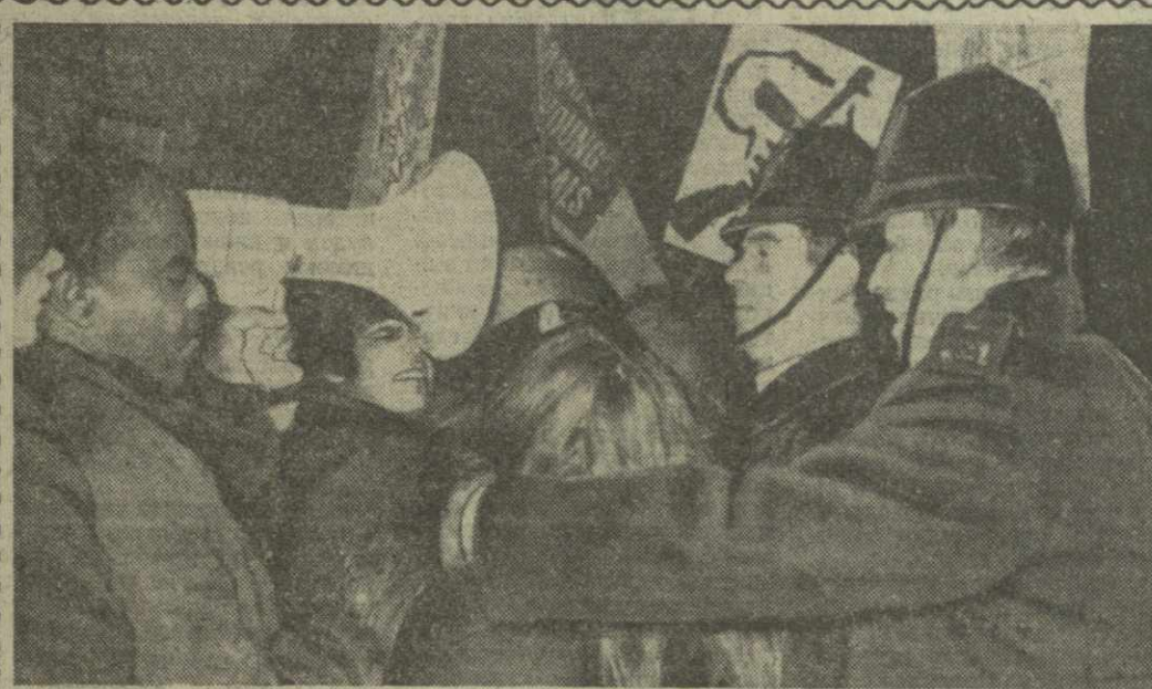
Лондон. Тысячи африканцев и англичан приняли участие в демонстрации протеста против правительства английского интересов африканского большинства Родезия. На снимке: полицейская расправа с участниками демонстрации.