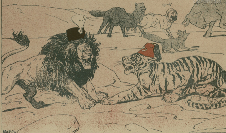
سرحد مسئلہ سی (اتحاد اسلام)