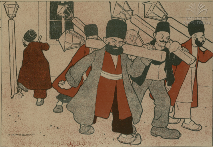
рис. В. ШИНН