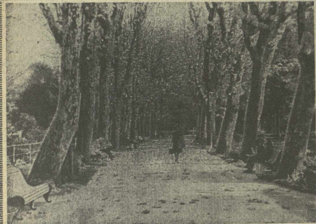
ГАГРА. ПЛАНОВАЯ АЛЛЕЯ.