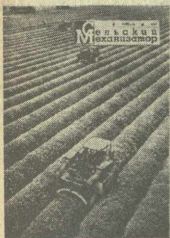
учебно-опытное хозяйство «Эшер» и других, о которых рассказывается в журнале.