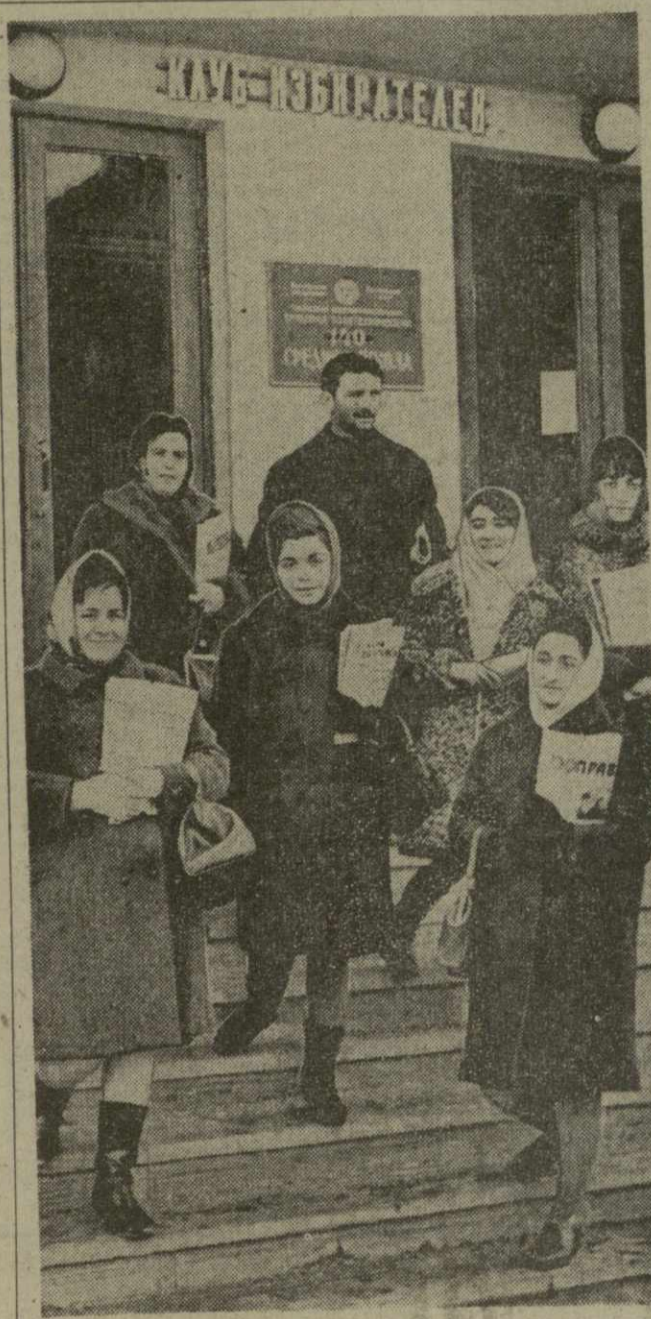
С каждым годом расширяются границы столицы Грузии. На бывшей окраине города — Дигомском массиве в декабре вступают в эксплуатацию новые жилые корпуса, где сплелись новоселье сотни наших горожан. Сейчас здесь возник новый избирательный участок № 3, который разместили в здании средней школы № 140. На снимке: политинформаторы клуба избирателей отправляются к новоселам для проведения бесед.

Новая магистраль к «Шалашу» в Разливе На берегу озера Разлив строители треста «Лендорстрой» приступили к прокладке широкой четырехкилометровой асфальтовой магистраль от Приморского шоссе к историческому памятнику — музею «Шалаш» В. И. Ленина. Дорожники ведут укрепление берега. Подготовку полотна они начинают к началу теплых дней, а после этого приступят к укладке асфальта. (Корр. ТАСС). Ленинград.