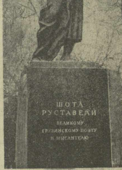
ШОТА РУСТАВЕЛИ — ВЕЛИКОМУ ГРУЗИНСКОМУ ПОЭТУ И МИСЛТЕЛЮ