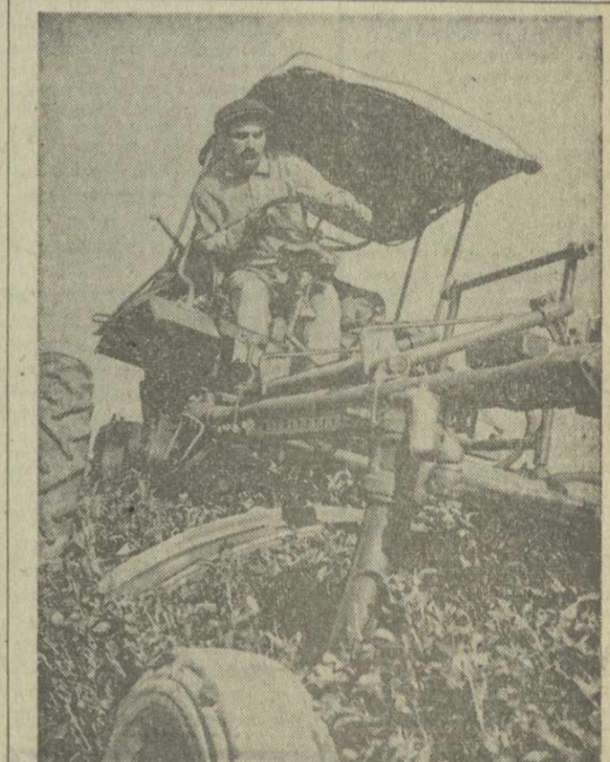
Грузинские конструкторы и инженеры создали многие механизмы, облегчающие работу тружеников зеленых плантаций, сделавшие ее высокопроизводительной.

Решения октябрьского Пленума ЦК КПСС требуют дальнейшего расширения рядов сельских механизаторов. Это в известной мере отно-