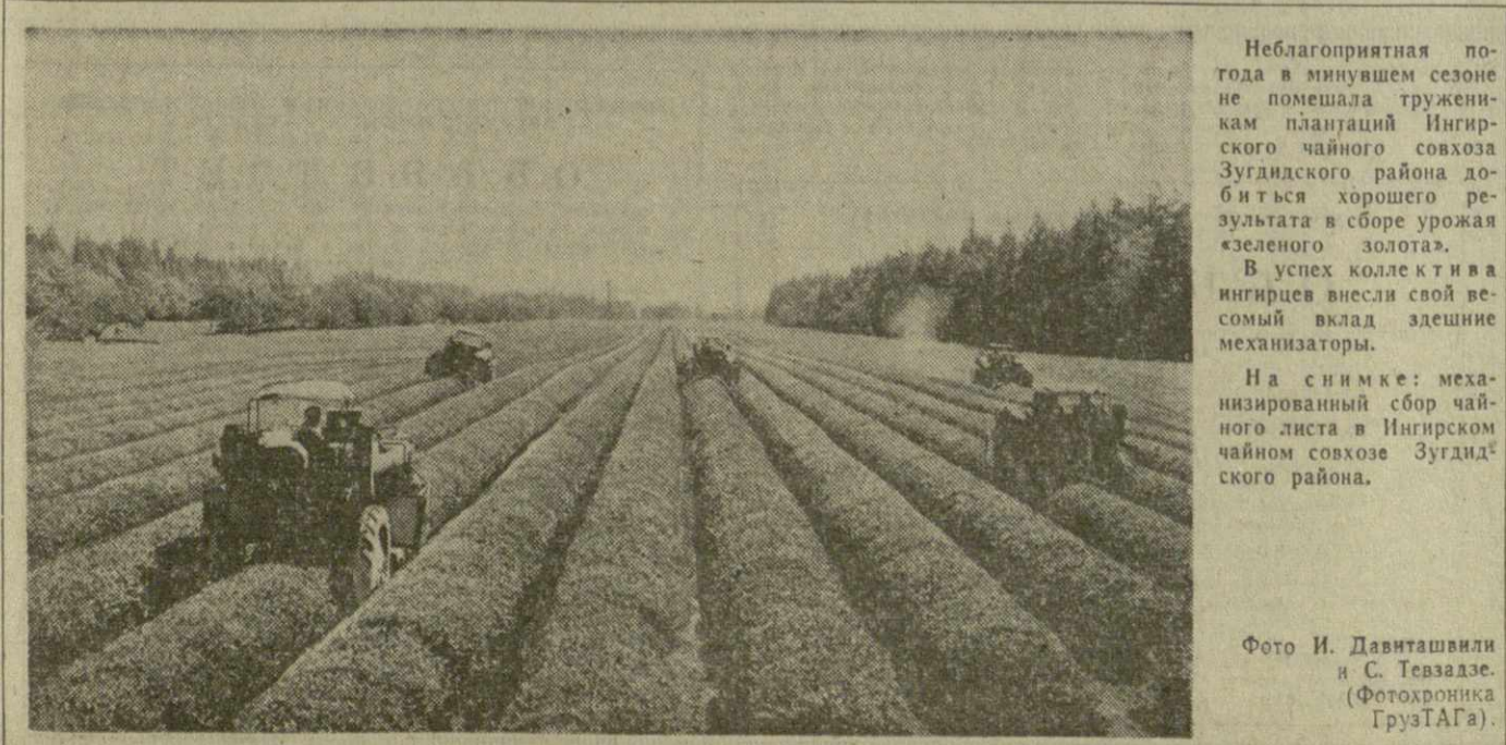
На снимке: механизированный сбор чайного листа в Ингирском чайном совхозе Зугдидского района.