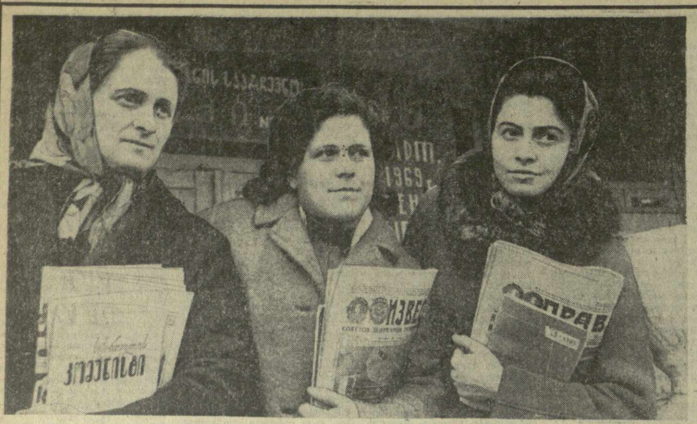
Агитаторы клуба избирателей при правлении колхоза села Хуцубани Кобулетского района ведут сейчас большую работу. Они проводят беседы, приносят на колхозные поля свежие газеты.