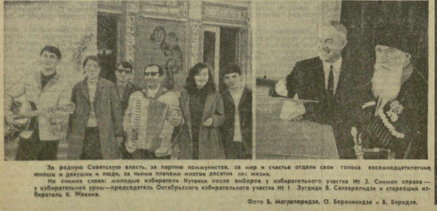
За родную Советскую власть, за партию коммунистов, за мир и счастье отдали свои голоса восемнадцатилетние юноши и девушки и люди, за чьи плечи многие десятилетия несли мир. На снимке слева: молодые избиратели Кутанси после выборов у избирательного участка № 2. Снимок справа — у избирательной урны — председатель Октябрьского избирательного участка № 1 Зугиди В. Сакарелидзе и старейший избиратель К. Жванца.