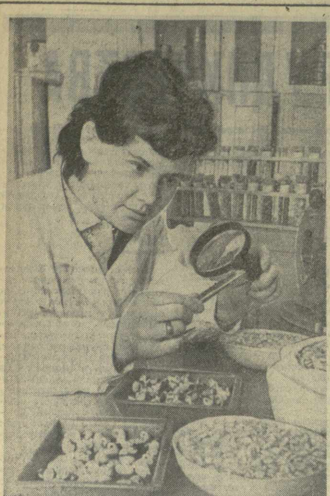
Сухумская районная семенная инспекция обслуживает двадцать колхозов района. Сейчас здесь идет вторая (предпосевная) проверка семян кукурузы, фасоли и сои.