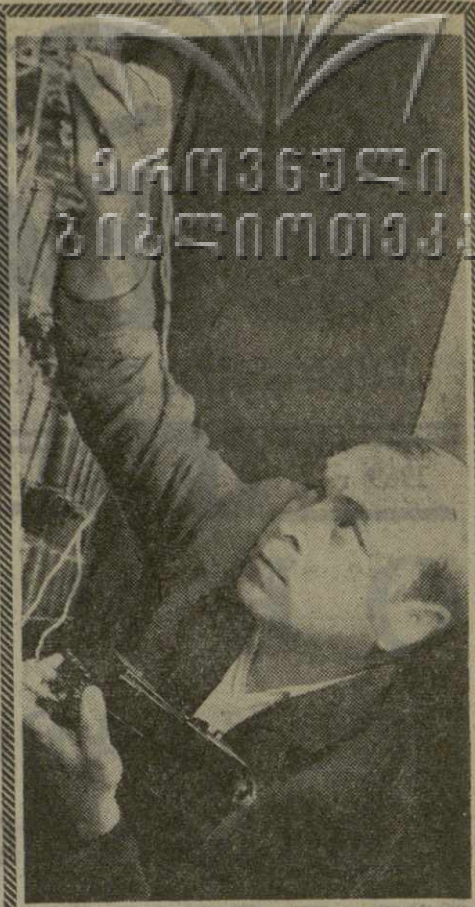
На Тбилиском электровозостроительном заводе имени Ленина построен экспериментальный образец электровоза ВЛ-89. Он уже прошел заводские тяговоэнергетические испытания и получил хорошую оценку.

В институте налажена работа по изучению трудов вождя. Совместно с обществом «Знание» проводятся лек-