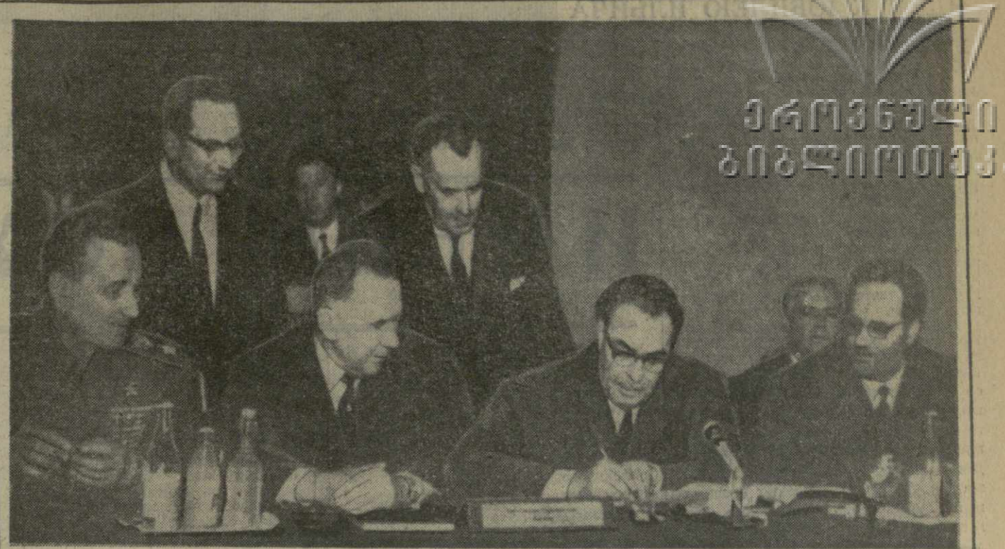
Будапешт, 17 марта 1969 г. От имени Союза Советских Социалистических Республик Генеральный секретарь ЦК КПСС Л. И. Брежнев подписывает Обращение государств — участников Варшавского Договора ко всем европейским странам.

Для осуществления этого важного действия, которое явилось бы историческим моментом в жизни континента, государства — участники совещания обращаются с торжественным призывом ко всем европейским странам укрепить климат доверия и в этих целях воздерживаться от любых действий, которые могли бы отравлять атмосферу в отношении между государствами. Они обращаются с призывом перейти от общих заявлений о мире к конкретным действиям и мерам по разрядке и разоружению, за развитие сотрудничества и мира между народами. Они обращаются ко всем европейским правительствам с призывом объединить свои усилия с тем, чтобы Европа стала континентом плодотворного сотрудничества между равноправными нациями, фактором стабильности, мира и взаимопонимания во всем мире.