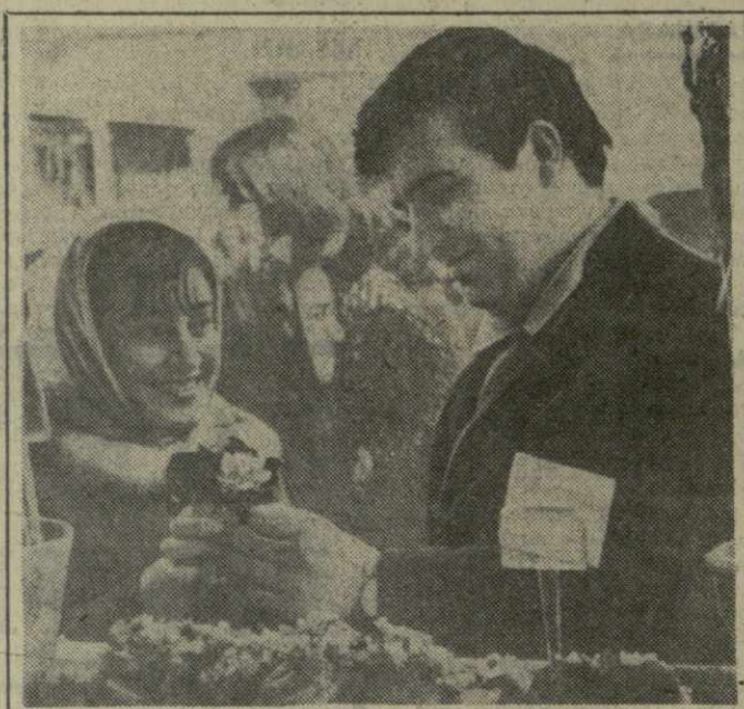
«Ранние цветы весной». Фотохудожник Г. Вахтагандзе.

В день открытия Недели Дом детской книги издательства «Накадули» во Дворце пионеров и школьников имени Б. Дзnelадзе устраивает карнавал «Мои любимые литературные герои». (ГрузТАГ).