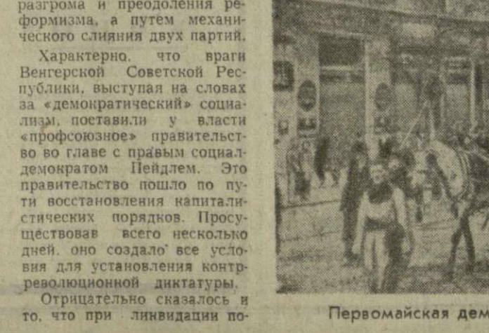
Первомайская демонстрация в Будапеште (1919 г.).

тий, всех антиимпериалистических сил» для предстоящего Международного совещания коммунистических и рабочих партий. Подготовленный проект документа передан на рассмотрение подготовительной комиссии.