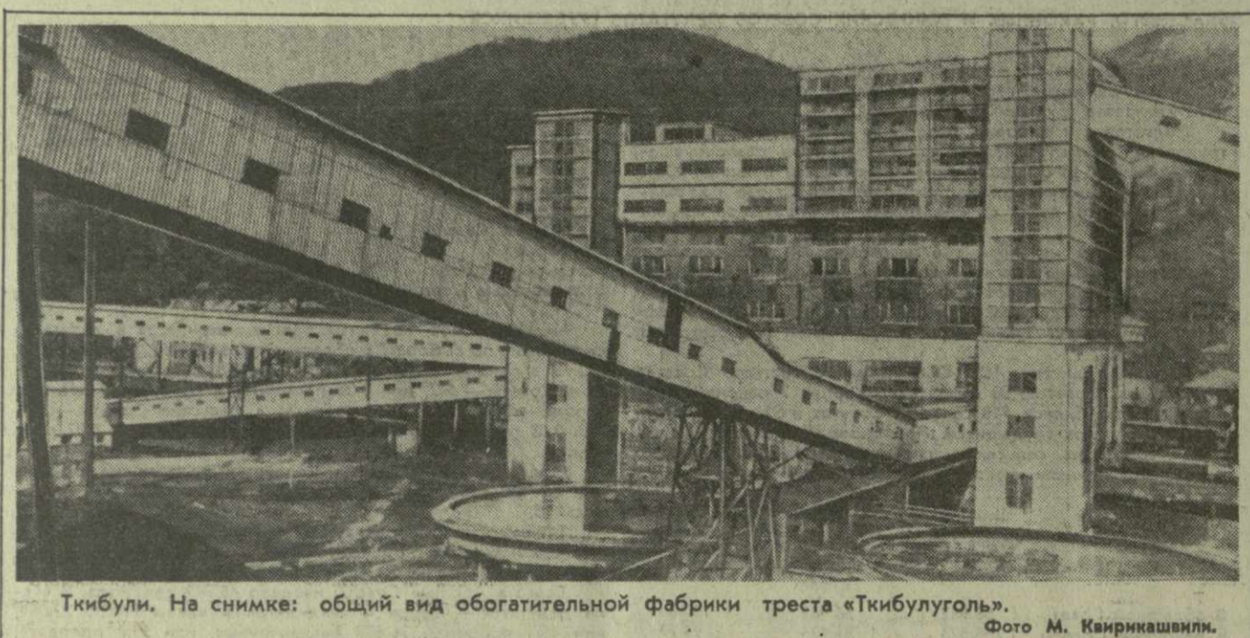
Ткибули. На снимке: общий вид обогатительной фабрики треста «Ткибулуголь».