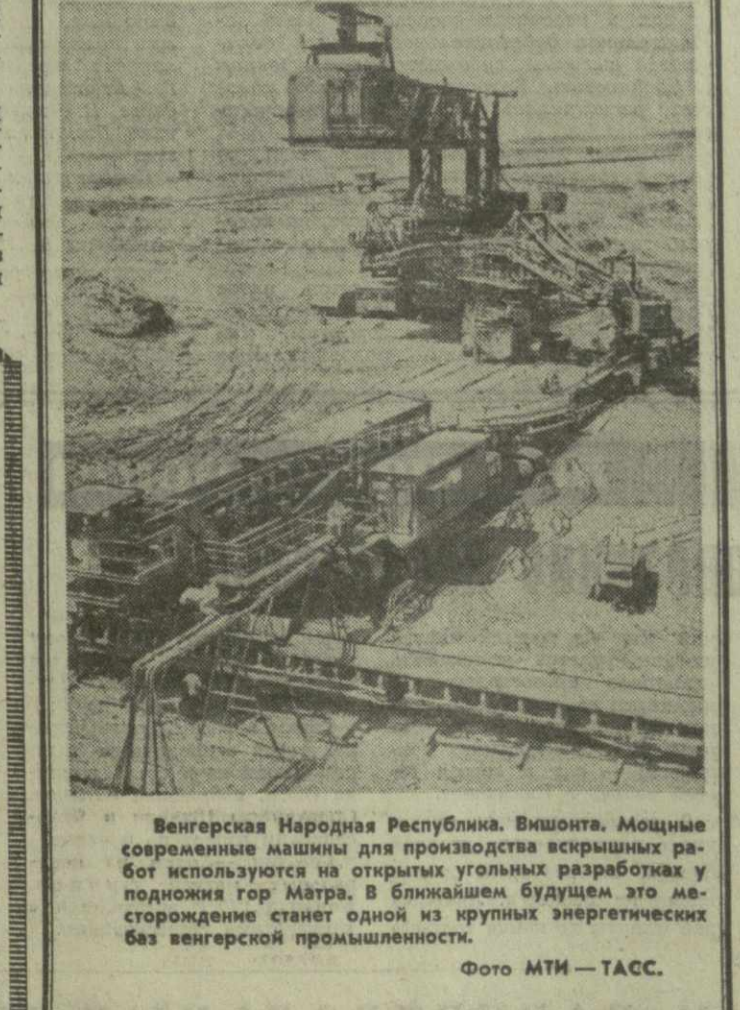
Венгерская Народная Республика. Мощные современные машины для производства вскрышных работ используются на открытых угольных разработках у подножия гор Матра. В ближайшем будущем это месторождение станет одной из крупных энергетических баз венгерской промышленности.

НЬЮ-ЙОРК Американская газета «Кричен сайенс монитор» излагает Обращение государств — участников Варшавского Договора к всем европейским странам с призывом о созыве общеевропейского совещания для обсуждения вопросов европейской безопасности и мирного сотрудничества. Страны — участницы Варшавского Договора, указывает газета, подтвердили свои предложения, направленные против разделения мира на военные блоки, гонки вооружений и угроз, вытекающих из этого для дела мира и безопасности народов. Они подчеркнули необходимость урегулирования политических, экономических и культурных связей между всеми государствами Европы».