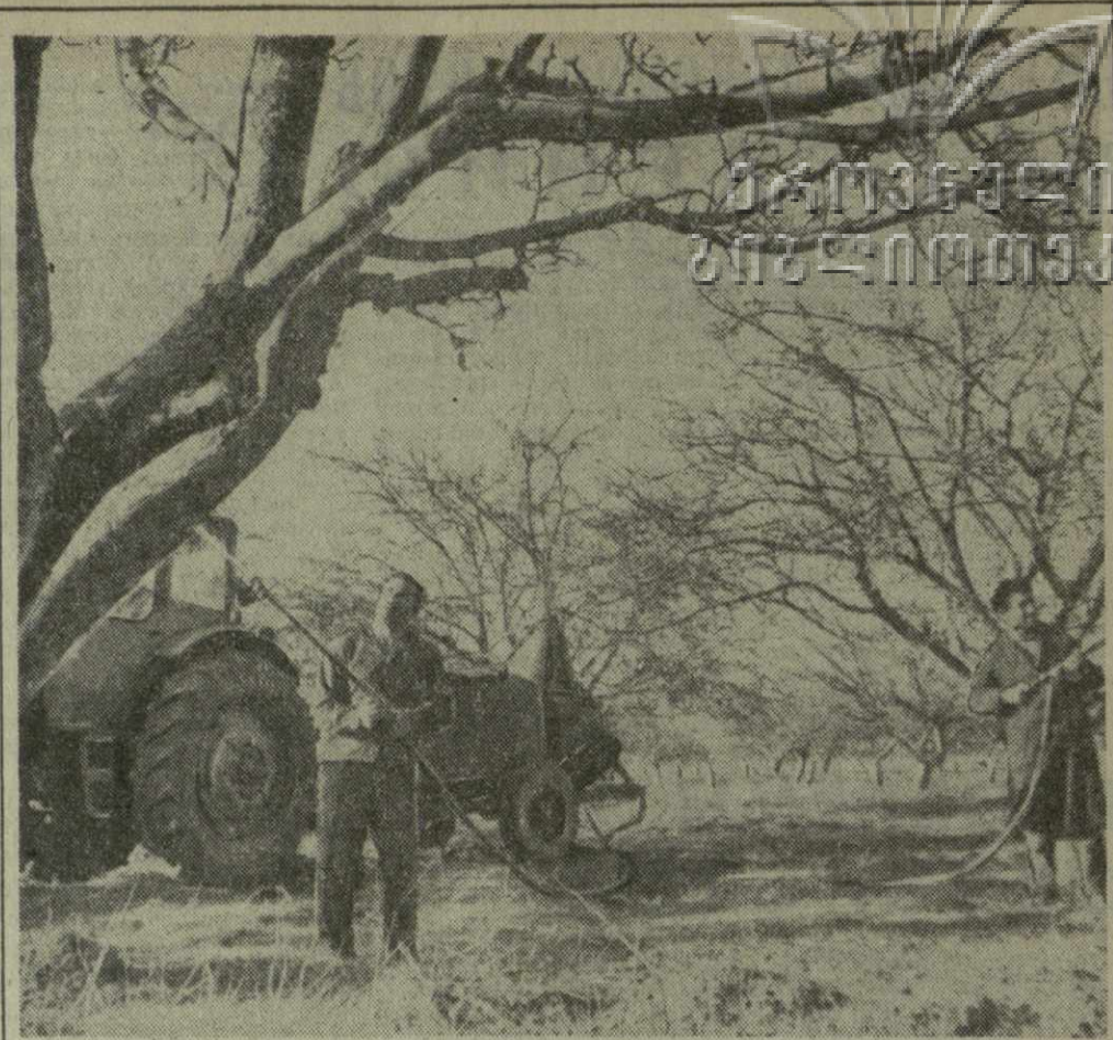
НА СМЕНУ НЕПРИБЫЧНО ЗАТЯНУВШЕЙСЯ И СУРОВОЙ ЗИМЕ ПРИШЛА, НАКОНЕЦ, ДОЛГОЖДАНАЯ ВЕСНА. НА СНИМКЕ: САДОВОДЫ КОЛХОЗА ИМ. Л. КЕЦХОВЕЛИ СЕЛА ТКВИАВИ ГОРИСКОГО РАЙОНА НАЧАЛИ ПОДРЕЗКУ И ЛЕЧЕНИЕ ЯБЛОНЕВЫХ САДОВ.

Экспедиция установила, что в диапазоне 20—40 сантиметров наблюдается заметное радиолучение, уверенно удовлетворенное оригинальными чувствительными приборами. Его сигналы оказались экзотическими, а время их жизни, измеренное в пору грозы, — чрезвычайно коротким — тысячные доли секунды. Этого недостаточно, чтобы поддерживать «жизнедеятельность» шаровой молнии.