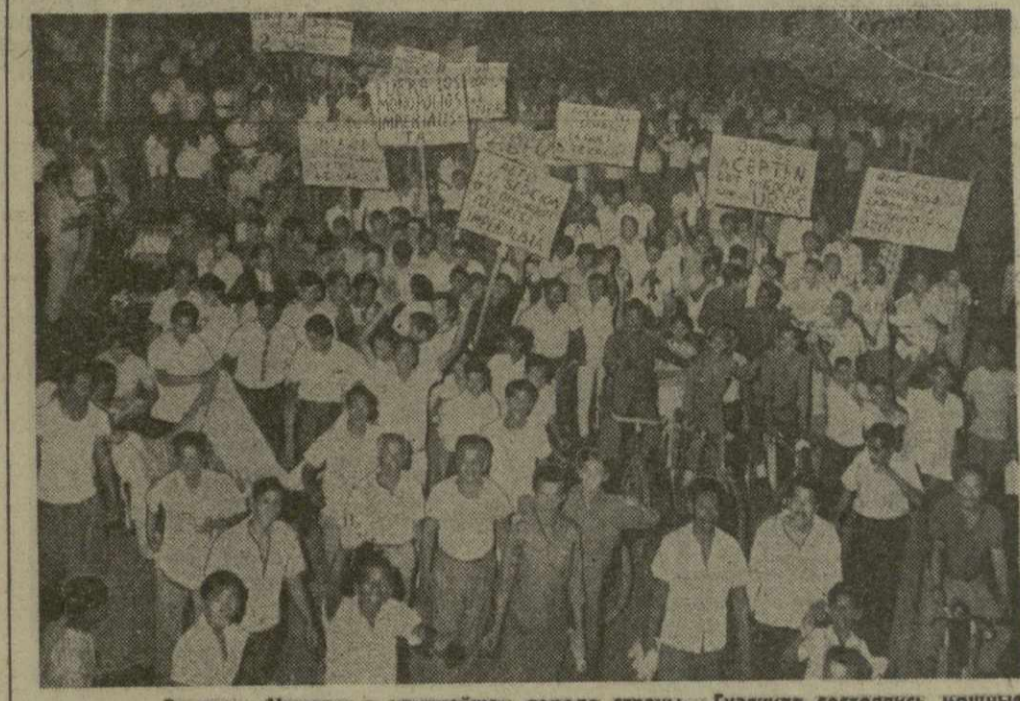
Экватор. Недавно в крупнейшем городе страны — Гуюяле состоялись мощные демонстрации трудящихся. Тысячи рабочих, служащих и студентов требовали улучшения условий жизни и труда, повышения заработной платы, национализации нефтяной промышленности, ликвидации господства американских монополий. На снимке: во время одной из демонстраций на улице Гуюяля. Надписи на лозунгах и плакатах гласят: «За национализацию нефти», «Снизить квартплату на 20 процентов», «Долой империалистические монополии».

местных рынках, принимать медицинские заказы, не имеющие большого значения для производства и в той программе, реализованной продукцией лишь в крайнем случае. Вся коммерческая работа была сосредоточена в тресте и синдикатах, имеющих обширную сеть своих отделений.