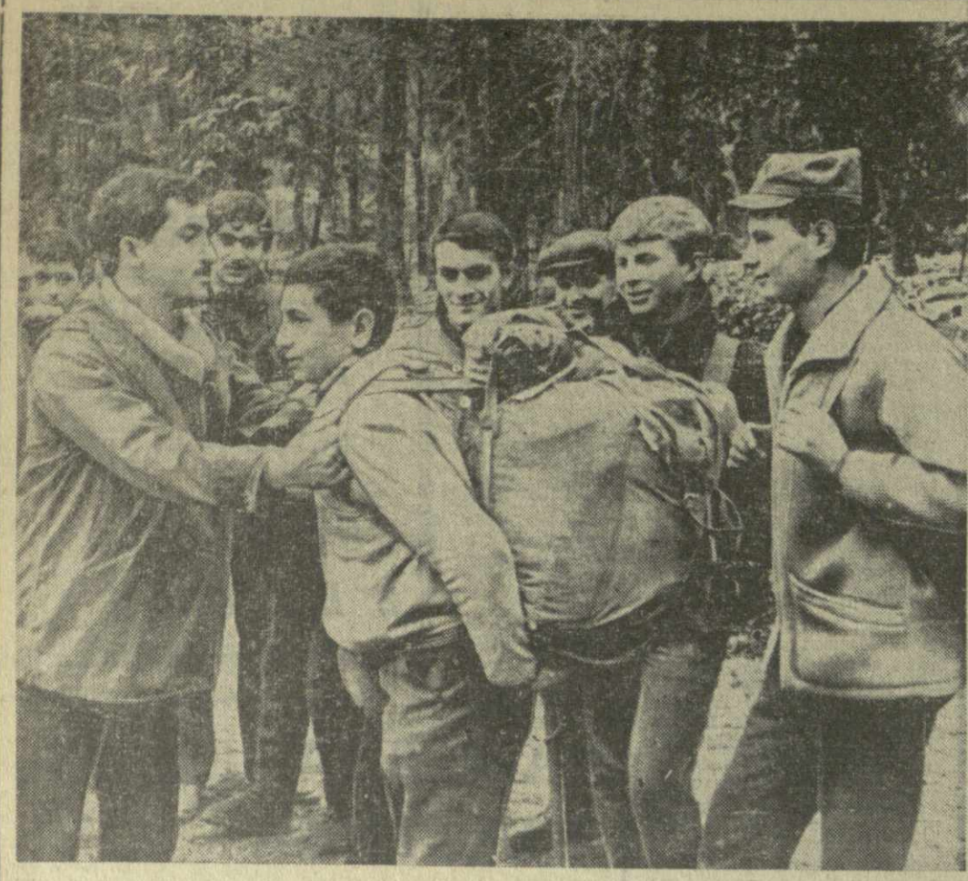
Содержатель и о провели школьники республике весенние каникулы. Тбилиские ребята посетили утренние спектакли, устраивали экскурсии по достопримечательным местам города, познакомились с новостройками.

Юные туристы кабинета по туризму и альпинизму Тбилиского дворца пионеров и школьников организовали поход в Лагодехский заповедник.