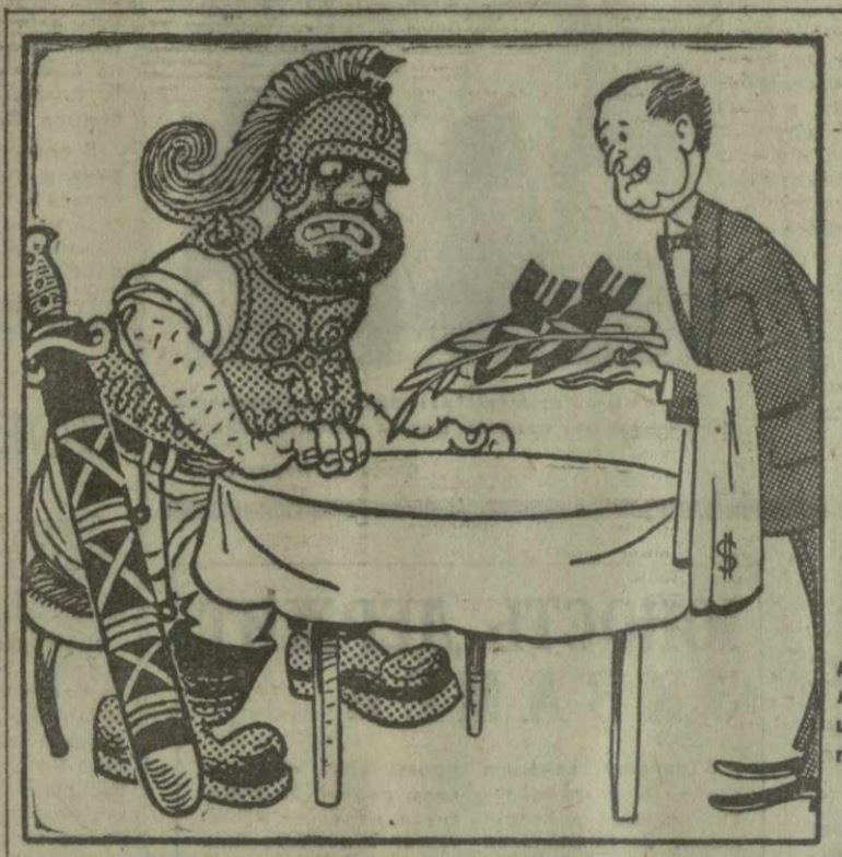
Под прикрытием разговоров о мире Пентагон расширяет преступную агрессию в Южном Вьетнаме. (Из газет).

«Они осмотрели аудитории, учебные кабинеты, присутствовали на занятии студентов второго курса экономического факультета».