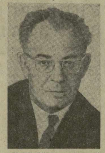
Густав Гусак, Первый секретарь ЦК КПЧ

Я покидаю Болгарию с самыми хорошими впечатлениями, желаю журналистам перед отлетом А. С. Елисееву. Я восторженно убедился в братских чувствах, которые болгарский народ питает к народам Советского Союза.