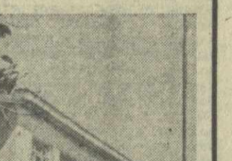
В Очамчире, на берегу горной реки Галдзга, закончено строительство здания детского сада-ясель на 140 мест. Сейчас здесь идут последние приготовления к приему малышей.