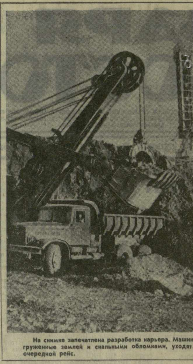
На снимке запечатлена разработка карьера. Машины, груженные землей и скальными обломками, уходят в очередной рейс.

Л. ШЕНГЕЛАЯ. [Спец. корр. «Зари Востока»].