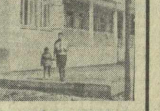
На снимке: новое здание детского сада-ясель.