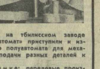
Недавно на тбилисском заводе «Электротомат» приступили к изготовлению полуавтомата для механической подачи разных деталей к прессам.