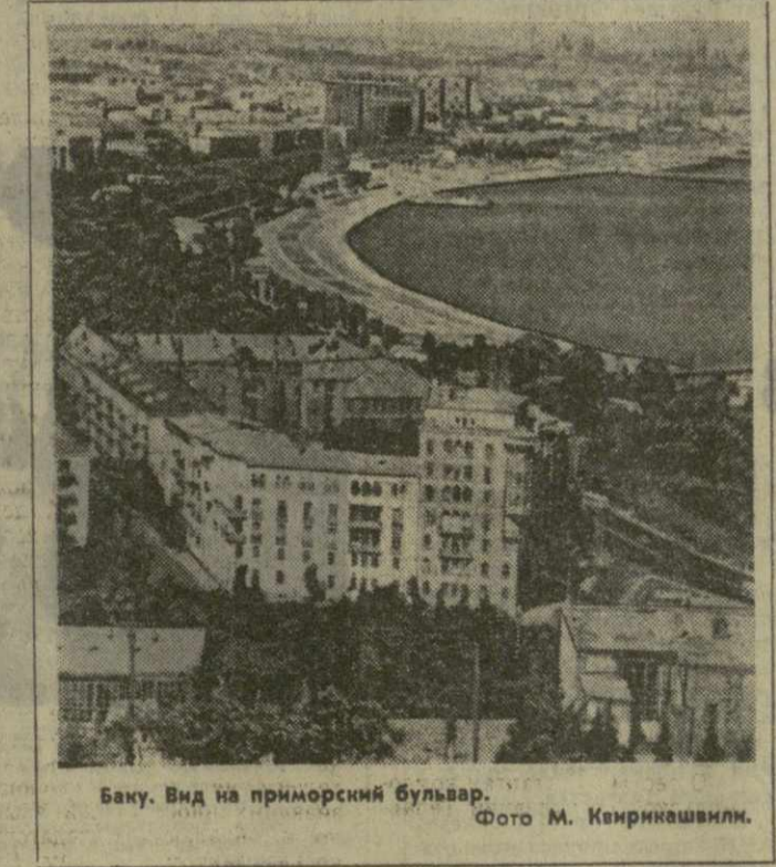
Баку. Вид на приморский бульвар.

ских комиссаров. Над прахом бакинских комиссаров сооружен мавзолей. В центре его, словно из-под земли, вырастает высеченная в граните фигура рабочего со скорбно сложенной головой. В выгнутой руке он держит чашу с огнем Вечной славы. Это символ нашей преданности заветам пламенных революционеров, готовности довести до конца начатое ими дело.