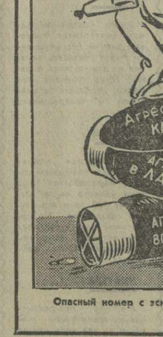
Опасный номер с эскалацией. Рис. А. Канделик.