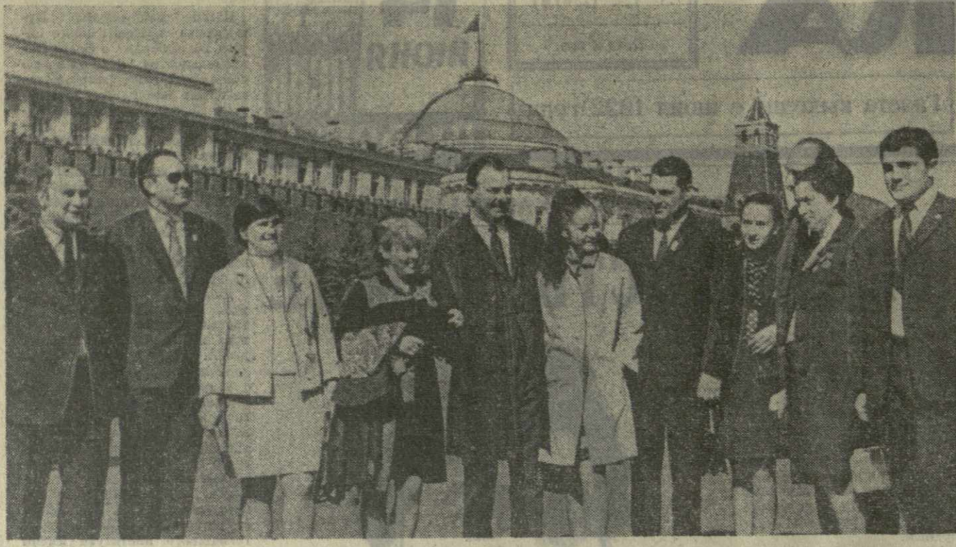
Группа делегатов XVI съезда ВЛКСМ от Грузинской ССР на Красной площади.

В своей глубокой и яркой речи, сказал он, товарищ Брежнев назвал союз науки, техники и производства главным условием нашего успешного движения вперед к коммунизму. Это значит — надо увеличивать вклад каждого в научно-техническую революцию, в дело строительства коммунизма. И в первую очередь это обязанность молодежи.