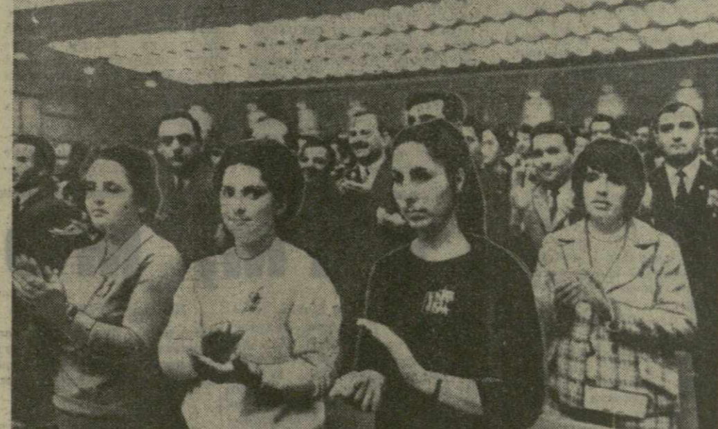
На снимке: в зале заседания XVI съезда ВЛКСМ. На переднем плане — делегаты из Грузинской ССР. ТАСС. (Принято по фототелеграфу ГрузТАГа).

ВИЗИТ НОРОДОМА СИАНУКА В ДРВ ХАНОИ, 26 мая. (ТАСС). По приглашению президента Демократической Республики Вьетнам Тон Дык Тханга