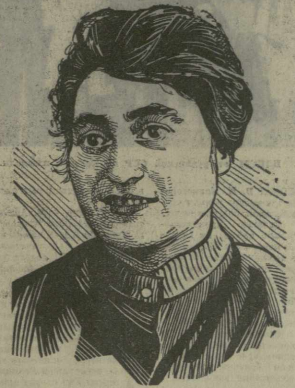
Е. ГОГОБЕРИШВИЛИ. Рис. Н. Кузьмина.