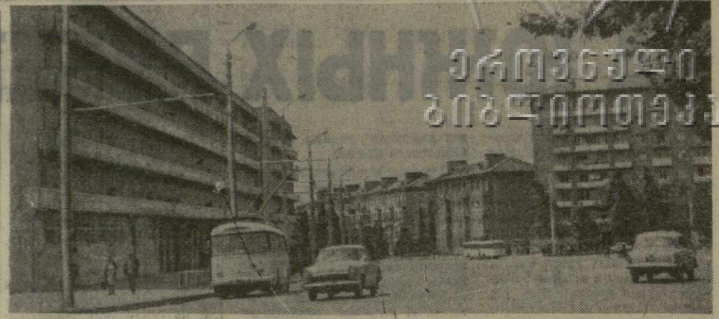
КУТАИСИ СЕГОДНЯ. На снимке: площадь Специалистов.