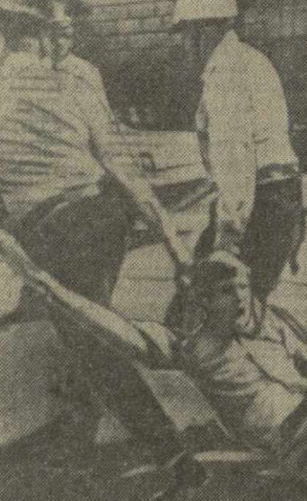
Расправа с демонстрантами.

РИМ. Газета «Унита» публикует сегодня сообщение о работе XVI съезда ВЛКСМ и речи на съезде Генерального секретаря ЦК КПСС Л. И. Брежнева. Газета выделяет те места в речи Л. И. Брежнева, где говорится о важнейшем значении коммунистического воспитания молодежи, «Унита» приводит также слова Л. И. Брежнева о том, что решение больших задач, поставленных партией, «по плечу лишь людям технически грамотным, высококвалифицированным».