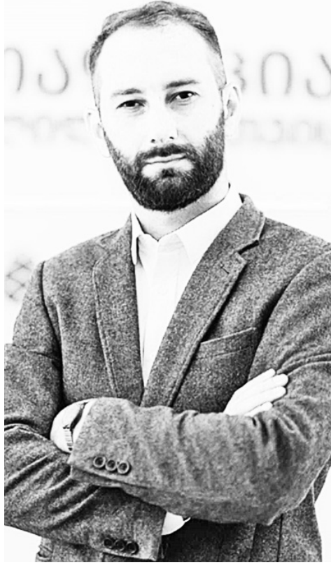
ნების შემდეგ პარტია „ნაციონალისტების“ აკრძალვის შესახებ...

- ჩვენ ერთ-ერთი გახლდით, ვინც პრეზიდენტის მიერ შემუშავებულ „ქართული ქართლას“ ხელი მოაწერა. ვფიქრობთ, რომ სასიცოცხლოდ მნიშვნელოვანია (პირველ რიგ-