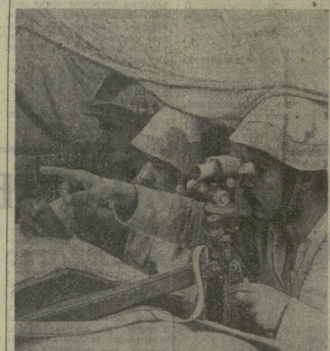
На военных маневрах

Д. МЕЛАШВИЛИ. (Спец. корр. «Заря Востока»). Познань — Варшава. По телефону.