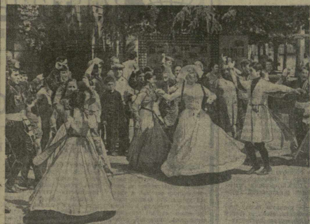
Выборы в Верховный Совет СССР стали всенародным праздником трудящихся. На улицах Тбилиси, тепло встреченные избирателями, выступали коллективы художественной самодеятельности. На снимке: выступление коллектива художественной самодеятельности клуба имени Плеханова.