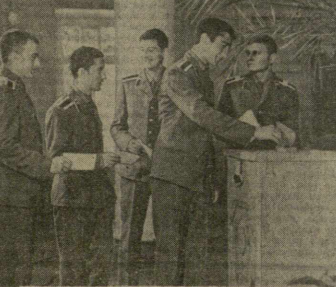
На снимке: молодые воины у избирательной урны.