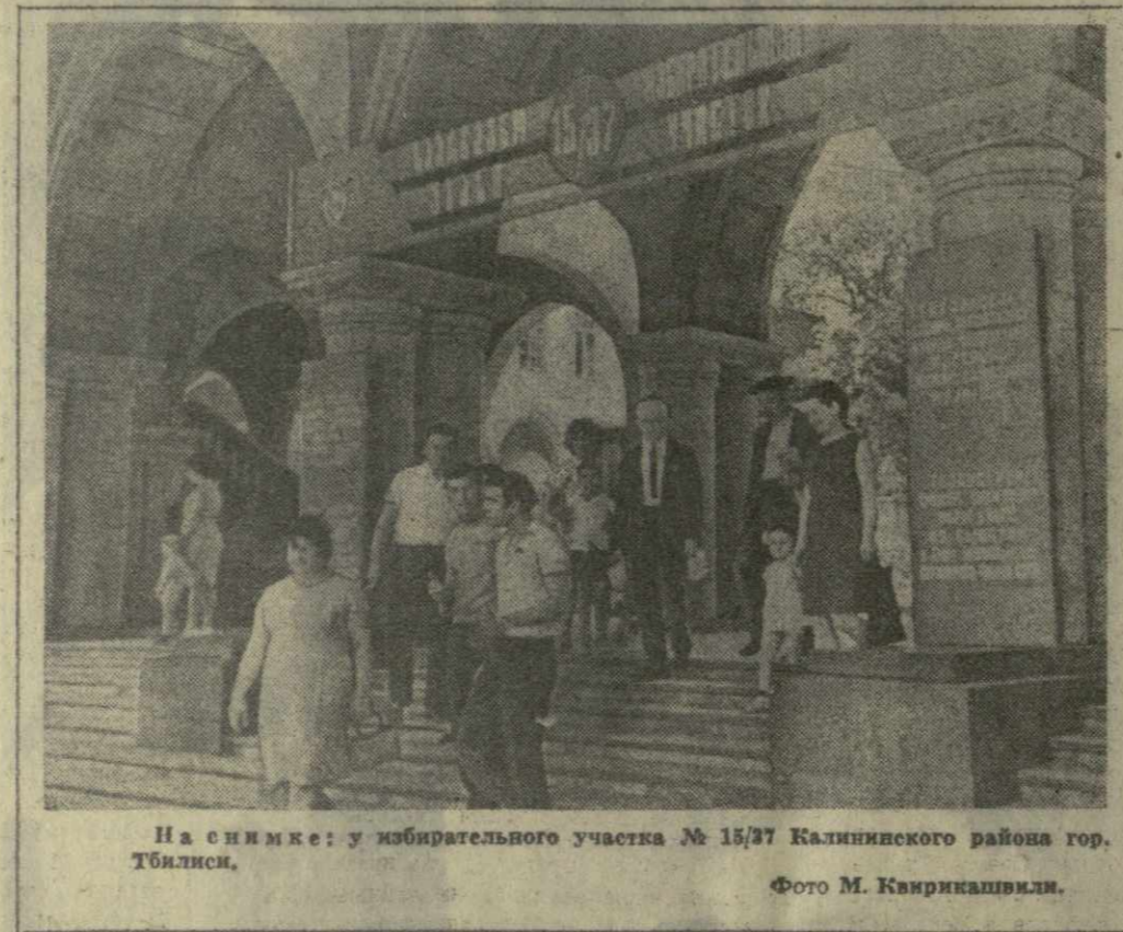
На снимке: у избирательного участка № 15/27 Калининского района гор. Тбилиси.

ИЗМЕНЕНИЯ, которые произошли в Первомайском районе за четыре года, со дня предыдущих выборов, хорошо видны на примере Дигомского массива.