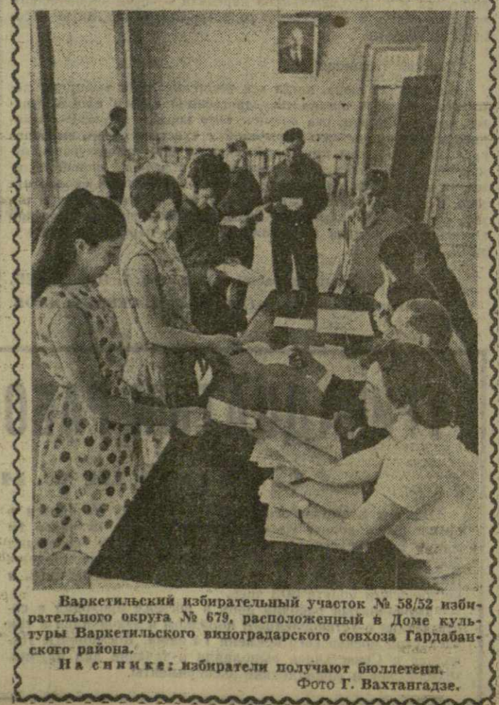
Варкетильский избирательный участок № 58/32 избирательного округа № 679, расположенный в Доме культуры Варкетильского виноградарского совхоза Гардабанского района. На снимке: избиратели получают бюллетени.