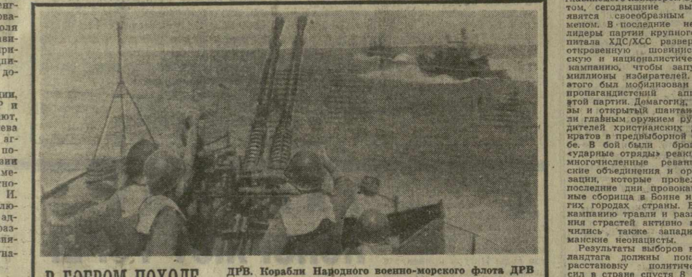
В БОЕВОМ ПОХОДЕ. ДРВ. Корабли Народного военно-морского флота ДРВ в боевом походе.

Результаты выборов в три ландтага должны показать расстановку политических сил в стране спустя 8 месяцев после выборов в западногерманский бундестаг, которые состоялись 28 сентября прошлого года.