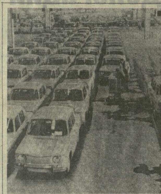
НА КОНВЕЙЕРЕ — «ДАЧИЯ-1100» Румыния. Эти легковые автомобили «Дачия-1100» сошли с конвейера завода легковых автомобилей в Питешти. Они пользуются большим спросом у автолюбителей.

КАМПАЛА, 7 июля. (ТАСС). Намеание Англии возобновить поставки оружия ЮАР рассматривается в Уганде как прямое потворство консервативного правительства политике апартеида. Об этом заявила президент Уганды Милтон Оботе в интервью корреспонденту английской газеты «Обсервер». Английское оружие, подчеркнул президент, будет использоваться южноафриканскими расистами против африканцев — коренных жителей страны, борющихся за свою свободу, а также против соседних африканских государств.