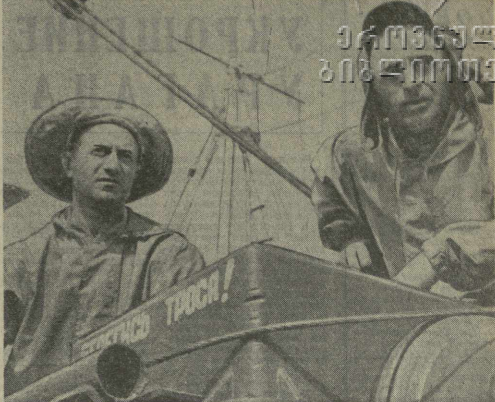
Большими трудовыми успехами встречают свой праздник — День рыбака труженики сухопутного рыбохозяйственного колхоза. Исполняют задание по добыче рыбы они выловили еще в прошлом году и сейчас имеют на своем счету почти 50 тысяч центнеров рыбы сверх плана.

Рыбохозяйственные предприятия Грузии проводят твердый курс на комплексную механизацию и автоматизацию производственных процессов добычи рыбы и производства рыбной продукции, более рациональное использование внутренних ресурсов, внедрение научной организации труда.